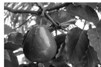
Gambar 1. Varietas Ijo Panjang Gambar 2. Varietas Ijo Bundar

kandungan total fenol antara alpukat varietas Ijo Panjang dan Ijo Bundar.