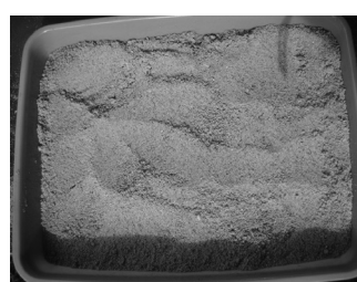
Gambar 4. Tepung alpukat Ijo Bundar