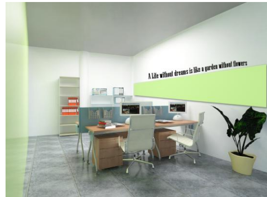
Gambar 8. Dinding pada area kerja administrasi dan keuangan