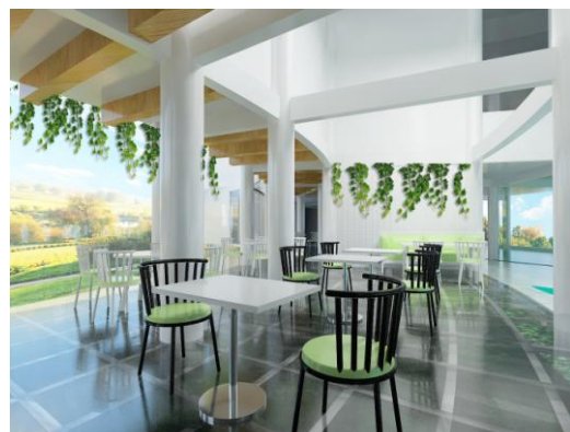
Gambar 5. Lantai kaca pada area flower café