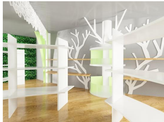
Gambar 9. Dinding pohon pada area galeri artificial lantai 2