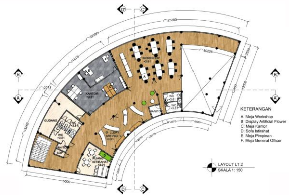
Gambar 3. Layout lantai 2 perancangan “Viola Florist Centre”

yang terletak di lantai 1 dijadikan satu area terbuka yang hanya dipisahkan dengan partisi transparan.