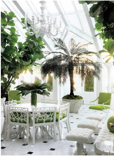
Gambar 1. Contoh interior dengan tema garden

diletakkan menggantung seperti melayang sehingga tampak seperti di luar angkasa. Gaya ruang yang digunakan adalah perpaduan kontemporer sehingga dengan tema yang ada, suasana diharapkan tampak menjadi lebih hidup dan fresh seperti sedang berada di sebuah garden .