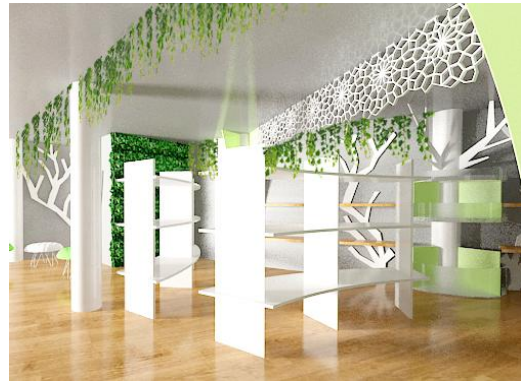
Gambar 13. Laser cutting pada area galeri lantai 2

Pada area galeri artificial , menggunakan elemen dekoratif berupa laser cutting dengan motif geometris bunga yang menempel di plafon dan dihubungkan antara kolom yang datu dengan kolom yang lain. Material dari laser cutting yang digunakan adalah metal dengan cat warna putih.