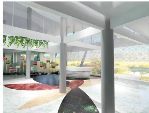
Gambar 4. Lobby “Viola Florist Centre”

Penerapan konsep pada lantai di lobby menggunakan mozaik bentuk bunga dengan material marmer custom dan marmer tile. Material marmer glossy cocok untuk area publik yang utama, dengan maintenance yang mudah [3]. Warna mozaik yang digunakan merupakan warna-warna natural.