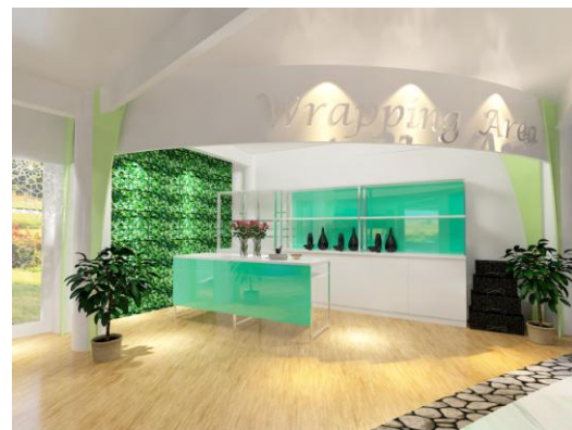
Gambar 14. Dinding menggunakan rumput artificial pada wrapping area

Pada area galeri artificial , menggunakan elemen dekoratif berupa laser cutting dengan motif geometris bunga yang menempel di plafon dan dihubungkan antara kolom yang datu dengan kolom yang lain. Material dari laser cutting yang digunakan adalah metal dengan cat warna putih.