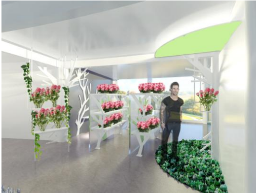
Gambar 11. Display bunga cut flower di galeri lantai 1

Bentukan yang digunakan sebagian besar geometri yang didistilasi berhubungan dengan konsep, yaitu bunga, pohon, ranting. Bentuk yang digunakan sederhana, untuk mendukung konsep modern kontemporer yang digunakan.