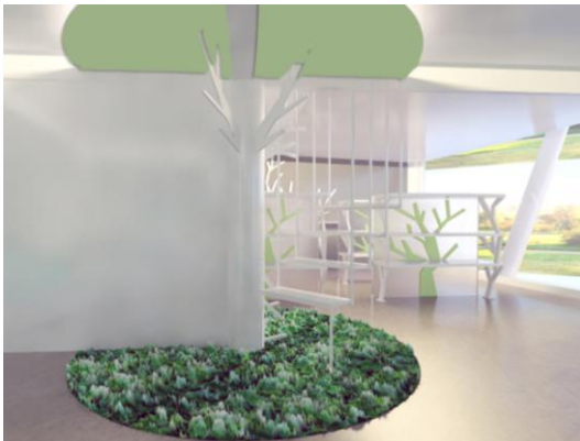
Gambar 12. Display menggantung pada area galeri lantai 1

Furniture yang digunakan sebagai display cut flower ada yang menggantung dan dibuat seperti tangga, sehingga bunga yang di display dapat terlihat dengan jelas. Penerapan konsep Outer Space Garden dalam furniture terlihat dari material, warna yang digunakan, dan juga sistem display yang digunakan. Selain menggantung, juga ada bunga yang di display menempel pada ranting pohon.