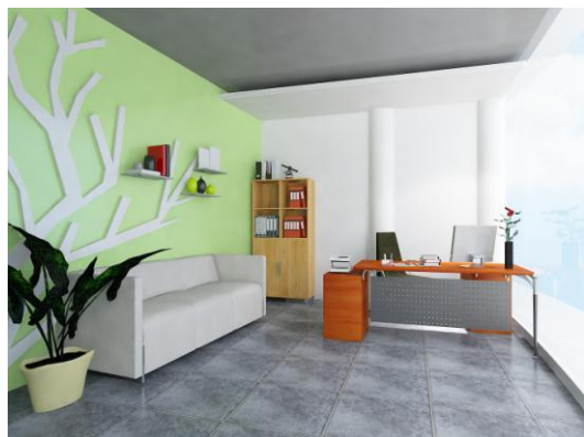
Gambar 7. Dinding pada area kantor ruang pimpinan

Untuk area kantor ruang pimpinan terhubung dengan area luar bangunan yang berupa kaca. Hal ini dapat dimanfaatkan sebagai masuknya cahaya matahari sebagai pencahayaan alami dipagi dan siang hari. Untuk mengatur masuknya cahaya matahari, digunakan vertical blind .