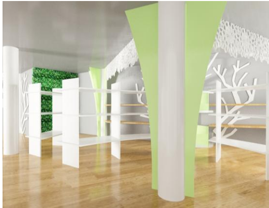
Gambar 6. Dinding menggunakan rumput artificial pada wrapping area

Material lantai pada area flower café , menggunakan kaca dengan konstruksi metal. Selain itu, pada area ini diberi kenaikan leveling 18cm. Didalam nya diberi rumput artificial hijau, sehingga nampak dari atas kaca. Dengan pemilihan material ini, membuat pengunjung seperti berjalan diatas garden , ini merupakan salah satu penerapan konsep pada desain lantai.