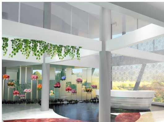
Gambar 10. Dinding partisi transparan pada area galeri lantai 1

Selain itu sebagian besar dinding bersifat transparant, yaitu menggunakan kaca. Hal ini mendukung salah satu penerapan konsep Outer Space Garden , yaitu open plan . Partisi pada galeri lantai 1, digunakan sebagai display fresh flower . Kaca yang digunakan adalah kaca buram dengan permainan tinggi sehingga terlihat bunga yang display menggantung.