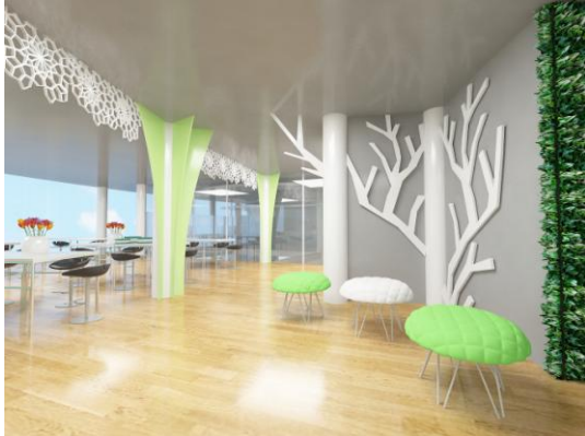
Gambar 16. Area ruang tunggu lantai 2 dekat workshop

Pada area workshop dibuat terbuka, untuk membatasinya digunakan pembatas berupa laser cutting yang menempel disepanjang plafon. Selain itu pada bagian kolom workshop dan galeri artificial diolah dengan memberikan penambahan bentuk melebar keatas berwarna hijau.