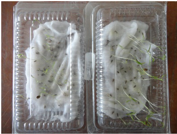
Gambar 4. Uji Benih tumbuh ( Seed viability test )