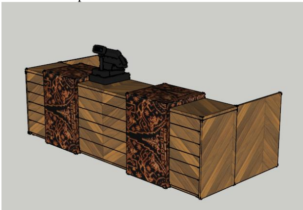
Gambar. 15. Perspektif Resepsionis

Area resepsionis pada bagian area masuk ke arah restoran didesain menyerupai kain adat NTT.