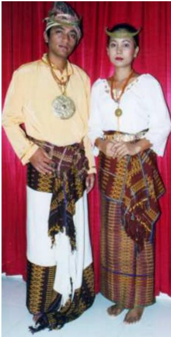
Gambar 4. Pakaian Adat Suku Helong