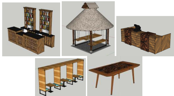
Gambar. 26. Perabot

Perabot yang digunakan sebagian besar menggunakan bahan multipleks. Bentuk-bentuk yang digunakan pada perabot lebih mengarah ke bentuk-bentuk perabot bergaya modern yang geometris, seperti persegi dan beberapa perabot seperti gazebo menggunakan desain atap menyerupai rumah adat budaya timor agar sesuai dengan tema perancangan yang di buat.