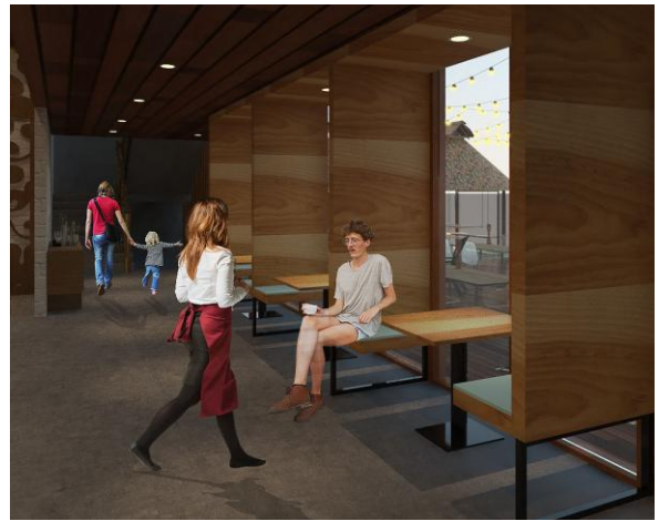
Gambar. 11. Perspektif indoor restoran