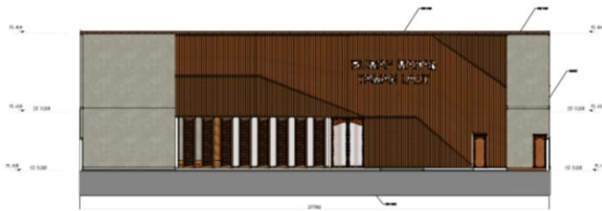
Gambar. 10. Main Entrance Sumber : Pribadi (2017)

Bagian main entrance pada bagian pintu masuk utama dibuat memiliki ukiran - ukiran berbentuk adat Timor seperti yang biasanya terdapat pada alnyaman pada kain adat. Dinding kayu menggunakan bahan wood plank dan menggunakan material concrete sebagai material pendukung serta menggunakan jendela kaca besar sehingga menarik bagi pengunjung.