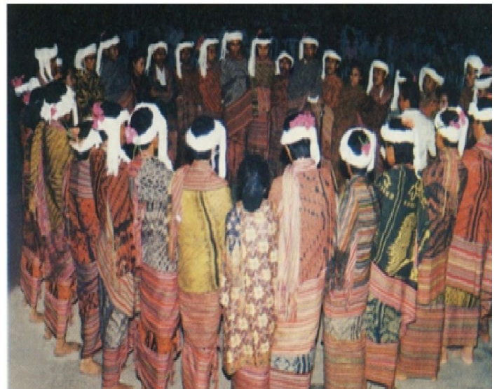
Gambar 6. Tarian Bonet

Tarian Bonet, merupakan tarian yang dilakukan dengan membentuk lingkaran dan bergandengan tangan. Dulunya tari Bonet digelar untuk meminta perlindungan Tuhan. Tetapi sekarang tari Bonet digunakan sebagai alat bantu pertunjukan dan digelar dalam situasi apapun seperti pernikahan dan penyambutan tamu.