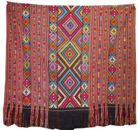
Gambar 8. Tenun Buna