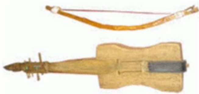
Gambar 2.26. Heo

Heo adalah alat musik gesek yang dibuat dari papan dengan alat gesek dari rangkaian ekor kuda. Heo memiliki 4 buah dawai dengan nada-nada dasar yang berbeda. Cara memainkan heo persis sama seperti cara memainkan biola pada umumnya.