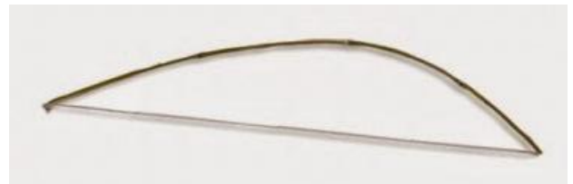
Gambar 2.28. Knobe Khabetas