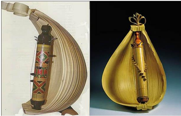
Gambar 2.25. Sasando

atau 84 dawai. Dawai-dawai tersebut dipasang melingkar bambu dengan panjang yang beragam.