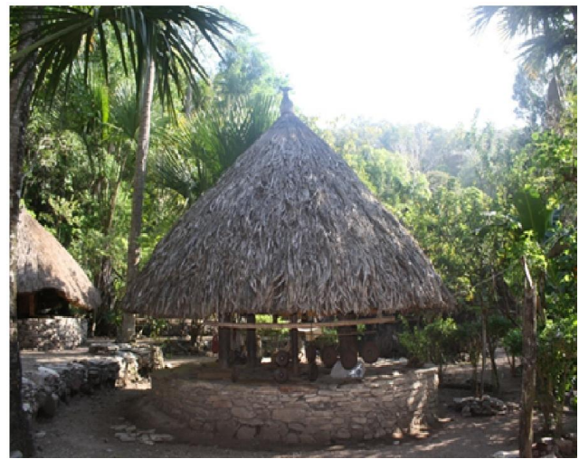
Gambar 5. Rumah Suku Dawan

Rumah adat Suku Dawan yaitu Lopo. Gambaran Lopo adalah sebuah rumah beratap bulat dengan empat tiang berdiri tegak pada bagian atasnya terdapat loteng. Lopo, bagi orang timor melambangkan laki – laki, dimana agak terbuka, kokoh dan sebagai tempat untuk pertemuan keluarga, dana selalu dipimpin oleh Bapak sebagai Kepala Keluarga.