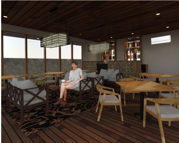
Gambar. 13. Perspektif bar area

Pada area bar lantainya menggunakan parket kayu dan menggunakan karpet bergambar tenunan khas NTT.