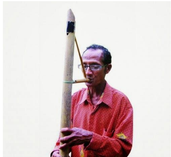
Gambar 2.27. Foy Pay

Sama seperti foy doa, foy pai juga termasuk jenis alat musik tiup. Foy pai berupa suling bambu dengan bentuk menyerupai angka 4. Alat musik ini menghasilkan nada-nada dasar antara lain Do, Re, Mi, Fa, dan Sol. Biasanya ia dimainkan untuk melengkapi permainan foy doa.