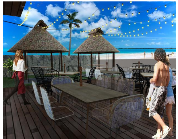
Gambar. 12. Perspektif outdoor

Pada area outdoor terdapat 2 buah set sofa yang saling menyamping dan juga meja panjang dan meja kotak. Selain itu ada 2 buah gazebo yang dibuat seperti ayunan pada bagian kursinya digunakan rantai besi sehingga lebih kokoh dan disambungkan dengan mejanya sehingga tidak bergoyang - goyang ketika pengunjung makan.