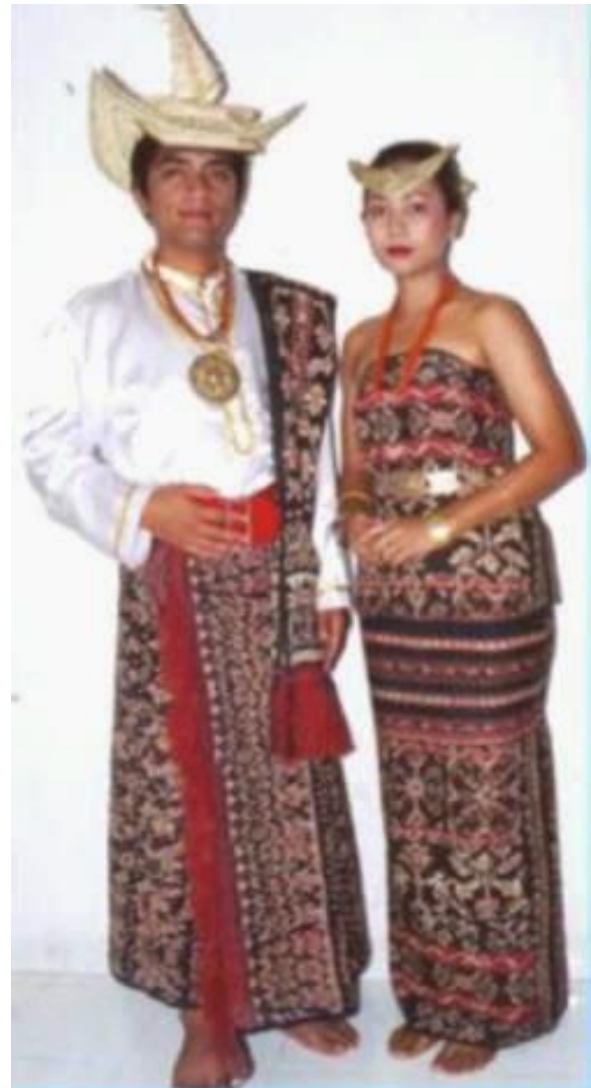
Gambar 3. Pakaian Adat Suku Tetun

Ti'i langga, yaitu penutup kepala yang berbentuk mirip dengan topi sombrero dari Meksiko. Ti'i langga terbuat dari daun lontar yang dikeringkan. Baju adat rote berupa kemeja berlengan panjang berwarna putih polos. Tubuh bagian bawah ditutupi oleh sarung tenun berwarna gelap, kain ini menjuntai hingga menutupi setengah betis. Motif dari kain ini bermacam-macam, bisa berupa binatang, tumbuhan yang ada tersebar di di kawasan Nusa Tenggara Timur. Dari motif yang nampak dari kain tenun tersebut dapat dilihat daerah asal pembuatan kain tenun tersebut.