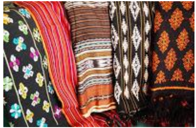
Gambar 7. Tenun Ikat