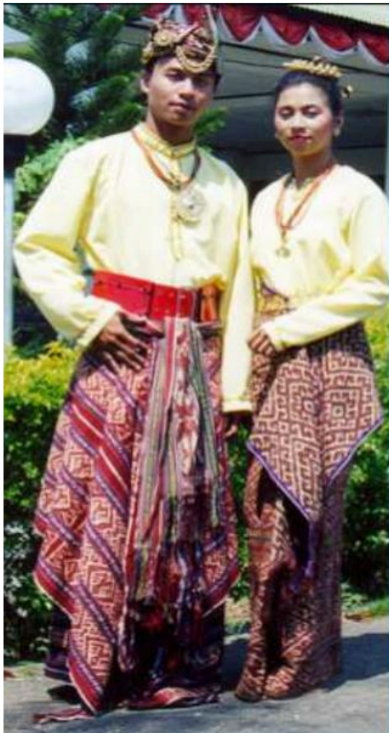
Gambar 2. Pakaian Adat Suku Dawan