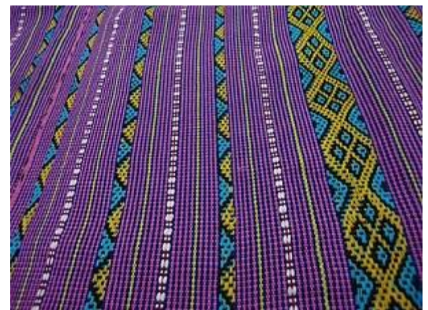
Gambar 9. Tenun Sotis