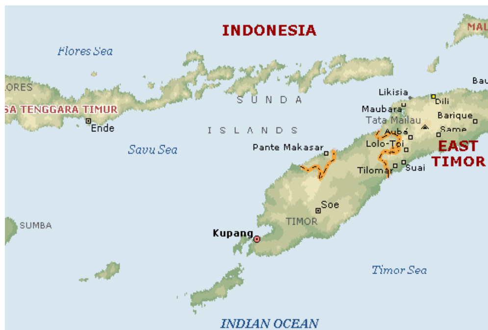
Gambar 1 :Lokasi Pelabuhan Tenau Kupang

Pelabuhan Tenau Kupang termasuk di wilayah PT (Persero) Pelabuhan Indonesia III yang berada di Propinsi Nusa Tenggara Timur. Pelabuhan ini merupakan sarana untuk menyelenggarakan tempat naik turunnya penumpang dan bongkar muat barang serta menunjang angkutan laut. Pelabuhan mempunyai peran aktif dan dinamis bagi kelancaran arus barang, hewan, dan mobilitas manusia.