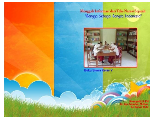
Gambar 2. Buku Guru

Bahan ajar menggali informasi dari teks narasi sejarah untuk menanamkan karakter pada peserta didik kelas V SD dikembangkan berdasarkan kriteria mutu (standar) buku teks pelajaran yang ditetapkan oleh Puskurbuk (2013) yang meliputi (1) kelayakan isi/materi, (2) kebahasaan, (3) penyajian, dan (4) kegrafikaan. Selain itu, bahan ajar ini dikembangkan berdasarkan prinsip-prinsip umum pengembangan bahan ajar menurut Depdiknas (2008) sehingga dihasilkan karakteristik bahan ajar menggali informasi dari teks narasi sejarah untuk menanamkan karakter pada peserta didik kelas V SD. Karakteristik bahan ajar tersebut terdiri atas prinsip - prinsip pengembangan dan prinsip - prinsip penggunaan pengembangan bahan ajar menggali informasi dari teks narasi sejarah untuk