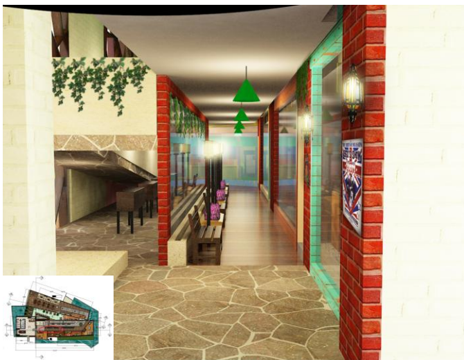
Gambar 5. Galeri lantai 1

Galeri memiliki area peruang yaitu galeri 1960, 1970, 1980, 1990. Dengan aplikasi bata ekspose pada dinding dan batu ekspose pada lantai, material ekspose adalah salah satu ciri rustic .