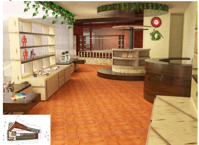
Gambar 7. Retail lantai 2

Galeri lantai 2 merupakan area untuk pameran foto per yang jalan permasa yaitu era 1960, 1970, 1980, 1990, dan era 2000, juga ada display pameran kamera kuno. Pada ujung ruangan terdapat area edukasi anak. Finishing tang digunakan untuk display dan para-plafon adalah jati belanda unfinish .