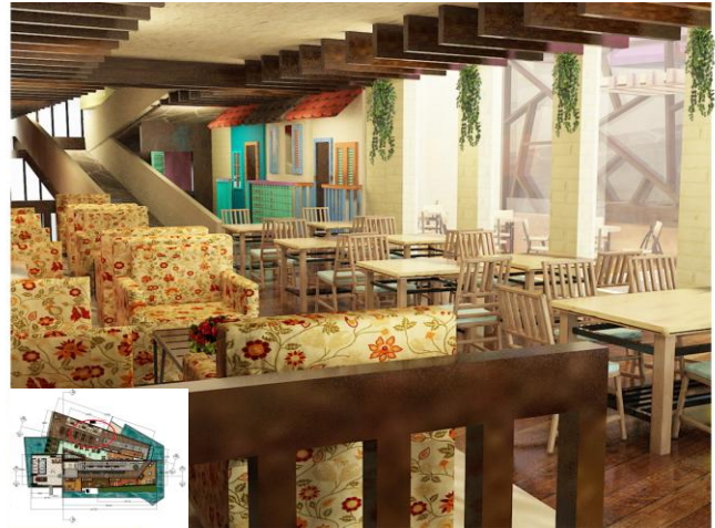
Gambar 3. Kafe indoor

Kafe indoor banyak menggunakan material kayu yang diaplikasikan di lantai, plafon, maupun perabot yang unfinish sehingga dapat memperkuat kesan rustic .