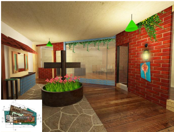
Gambar 4. Galeri lantai 1

Galeri memiliki area peruang yaitu galeri 1960, 1970, 1980, 1990. Dengan aplikasi bata ekspose pada dinding dan batu ekspose pada lantai, material ekspose adalah salah satu ciri rustic .