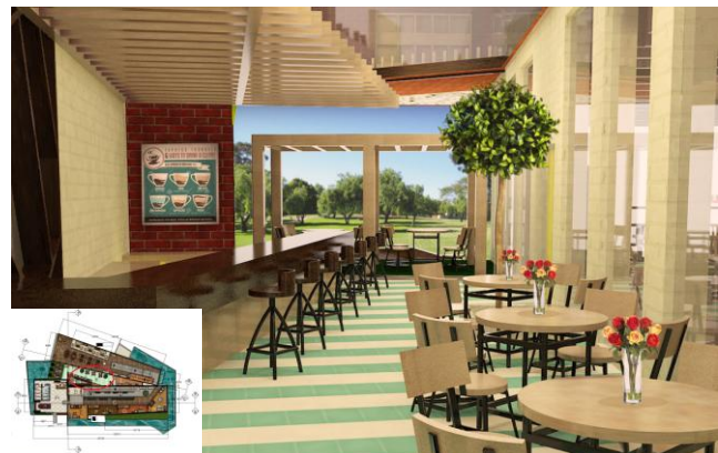
Gambar 4. Kafe Outdoor

Kafe indoor banyak menggunakan material kayu yang diaplikasikan di lantai, plafon, maupun perabot yang unfinish sehingga dapat memperkuat kesan rustic .