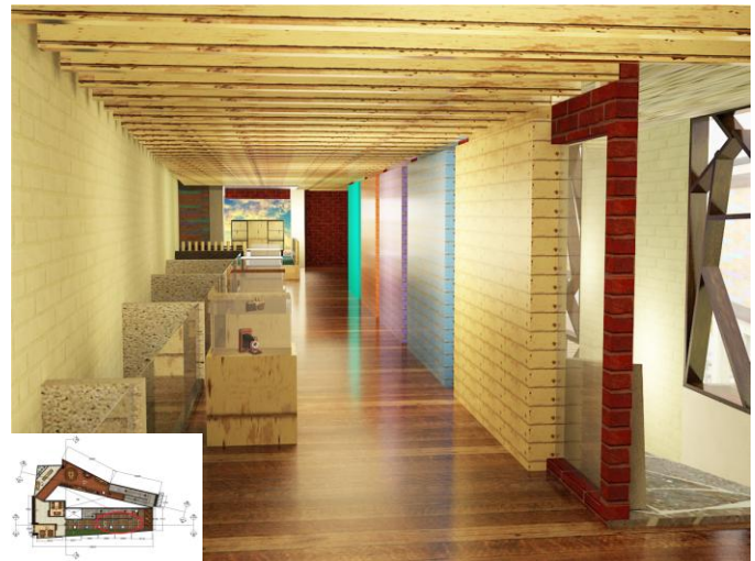
Gambar 6. Galeri lantai 2

Galeri pada lantai 1 ini dibuat seolah-olah sedang berada di teras lingkungan rumah, dan pada area pembatas diberi aliran air supaya terasa lebih asri dan dingin juga dapat membantu pencahayaan area bawah rem yang juga dapat di akses dan di lalui orang. Panel kayu cat unfinish juga di aplikasikan pada area ini, seperti pada area list jendela kaca pada setiap ruangan galeri. cat unfinish dapat membuat kesan old .