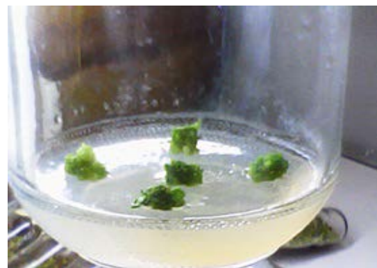
Gambar 4. Protocorm like bodies Dendrobium Jayakarta yang ditumbuhkan pada media Vacin & Went padat setelah perlakuan subkultur ketiga dengan perlakuan ribavirin 30 ppm (Plbs of Dendrobium Jayakarta grown on Vacin & Went media after the third subculturing with 30 ppm ribavirin)

Hasil penelitian tersebut mengindikasikan bahwa zat antiviral ribavirin pada taraf konsentrasi yang diuji memiliki aktivitas antiviral terhadap CymMV dengan kemampuan eliminasi berkisar antara 33,33–100%. Protocorm like bodies Dendrobium Jayakarta yang terbebas dari infeksi CymMV yaitu dari perlakuan