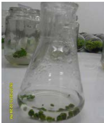
Gambar 3. Protocorm like bodies Dendrobium varietas Jayakarta terinfeksi CymMV yang diperbanyak dalam media Vacin&Went cair (CymMV infected plbs of Dendrobium Jayakarta propagated in liquid Vacin&Went medium)

Hasil penelitian tersebut mengindikasikan bahwa zat antiviral ribavirin pada taraf konsentrasi yang diuji memiliki aktivitas antiviral terhadap CymMV dengan kemampuan eliminasi berkisar antara 33,33–100%. Protocorm like bodies Dendrobium Jayakarta yang terbebas dari infeksi CymMV yaitu dari perlakuan