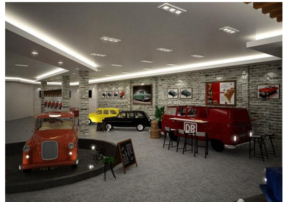
Galeri ruang pameran Volkswagen (2)

Area galeri ini merupakan area yang menceritakan perkembangan sejarah Volkswagen. Terdapat layar LCD pada area ruang pameran yang memudahkan pengunjung memahami sejarah Volkswagen. Pola lantai menggunakan concrete, yang memberi kesan lama.