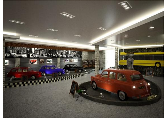
Galeri ruang pameran Volkswagen (1)

Pada area galeri futuristik ini menampilkan gambaran tentang Volkswagen pada era masa yang akan datang. Pada area ini menampilkan kesan hi-tech, dimana penggunaan materialpun terkesan modern.