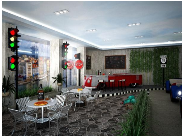
Area café (1)

Terdapat area penjualan yang menyediakan berbagai macam souvenir seputar Volkswagen.