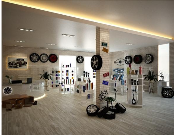
Area penjualan merchandise

Diakhir perjalanan pada area galeri, terdapat display mobil Volkswagen yang masih diproduksi hingga sekarang. Pada area ini disediakan pula marketing untuk penjualan mobil Volkswagen terbaru. Pada area ini, dinding menggunakan material composit yang memberi kesan modern dibandingkan area galeri lainnya.