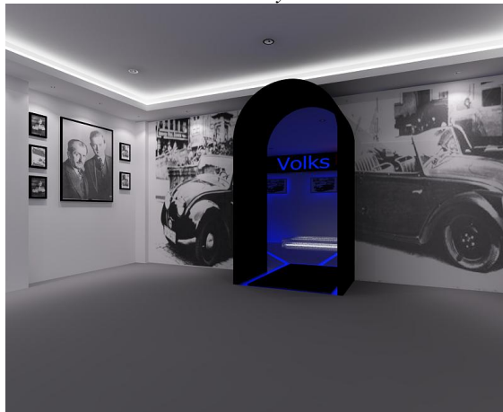
Galeri old style