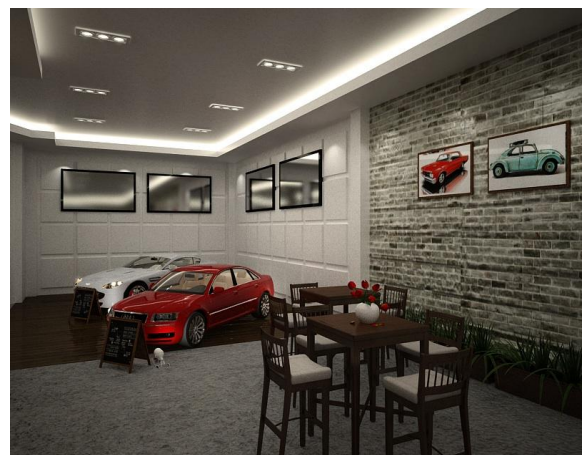
Galeri ruang pameran Volkswagen (3)

Dalam area galeri ini terdapat stand yang menjual food & beverages, sehingga pengunjung dapat menikmati hidangan yang disediakan sembari menikmati display mobil Volkswagen.