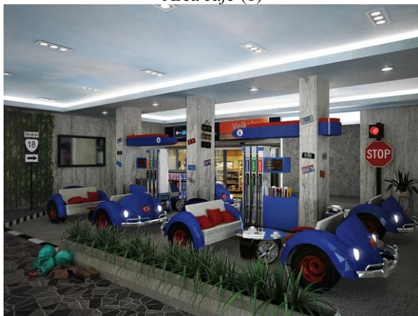
Area café (2)

Pada area café ini menampilkan desain yang berbeda dari area- area sebelumnya. Pada area café , desain menggunakan