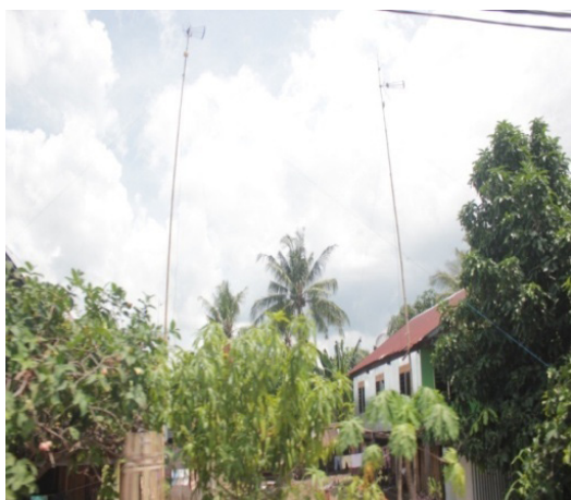
Antene TV di desa