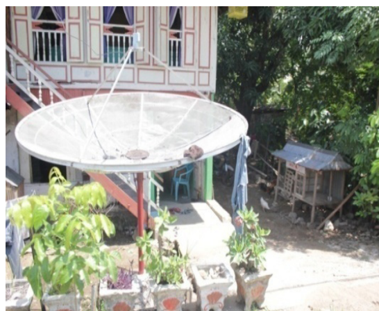
Antene parabola di desa

Penelitian ini berlangsung di empat kabupaten yaitu, Kabupaten Maros, Kabupaten Pangkep, Kabupaten Barru dan Kota Pare-Pare. Untuk tahap pertama kami mewawancarai informan di dua kabupaten yaitu Maros dan Pangkep, sedangkan untuk Kabupaten Barru dan Kota Pare-Pare, pada tahap sesudah pemeriksaan Monev.