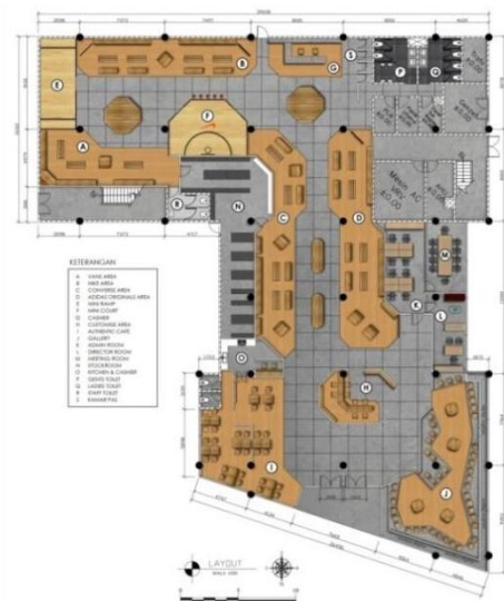
Gambar. 1. Layout Sneakers Addict Center

Layout perancangan ini didominasi oleh material semen plesteran dan dikombinasikan dengan warna kayu yang natural yang makin menyelaraskan perpaduan warna yang dihasilkan.