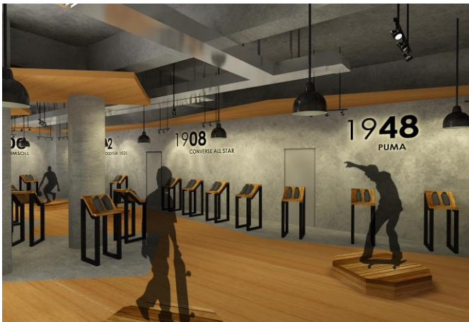
Gambar. 7. Gallery

Pola bentukan ruang yang digunakan di dalam gallery ini didesain agar pengunjung bisa di arahkan secara tidak langsung melalui elemen interior yang ada dan dengan bentukan yang relatif geometris membantu menegaskan alur sirkulasi area yang ada sehingga pengunjung dapat melihat sejarah sneakers secara berurutan dari awal hingga perkembangannya kini.