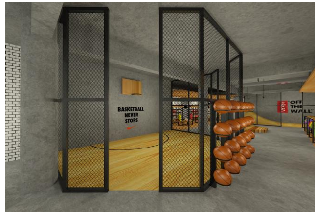
Gambar. 4. Mini Court

Perancangan ini juga dilengkapi dengan fasilitas Mini Court dan Mini Ramp dimana area ini berupa sebuah fasilitas permainan bola basket dan mini ramp skateboard untuk para pengunjung [7]. Dari kedua fasilitas ini memang disediakan untuk merasakan langsung ketika ingin membeli sebuah sneaker . Semacam simulasi ringan yang menjadi daya tarik tersendiri dalam perancangan ini.