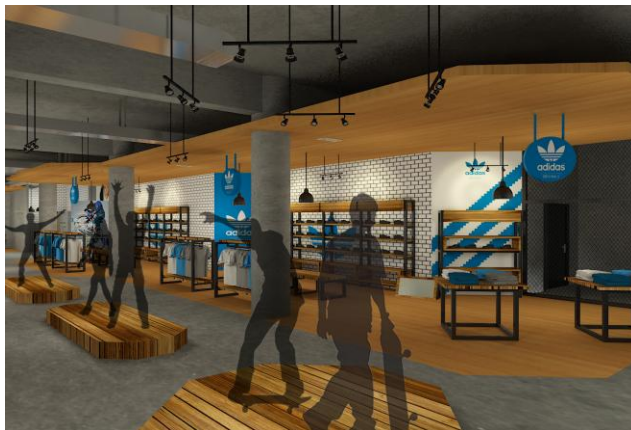
Gambar. 3. Adidas Originals Area

Penggunaan material pada mebel display menggunakan perpaduan kayu dengan besi hollow dengan minim finishing, hanya dengan finishing politur dan coating doff . Desain mebel keseluruhan menggunakan bentukan geometris sesuai dengan konsep yang digunakan.