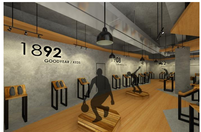
Gambar. 6. Gallery

Gallery ini berfungsi sebagai media informasi yang berisi tentang sejarah perkembangan sneakers yang dari awal kemunculannya hingga saat ini. Desain area ini cenderung sederhana dari penggunaan kombinasi materialnya yang hanya menggunakan plesteran semen dan warna kayu yang natural. Area ini lebih mengutamakan display sneakers yang ada dengan menggunakan pencahayaan spotlight yang menyorotkan cahaya lebih fokus dan beberapa lampu gantung sebagai pencahayaan menyeluruh [3].