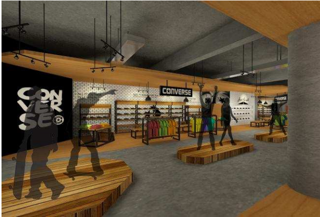
Gambar. 2. Converse Area

Store dirancang dengan suasana industrial dengan menghadirkan lantai dari cor semen dikombinasikan dengan material kayu serta material besi pada display dan dinding yang menggunakan keramik yang disusun motif bata. Plafond yang di ekspose tanpa penutup sehingga terlihat struktur balok pada langit plafond. Kesan industrial semakin kental dengan penggunaan lampu gantung yang biasa dipakai pada pabrik industri. Lalu dikombinasikan dengan beberapa lampu sorot untuk menonjolkan sneakers maupun barang yang ada di display dan lampu TL untuk membantu tata cahaya agar tidak terlalu gelap [1].