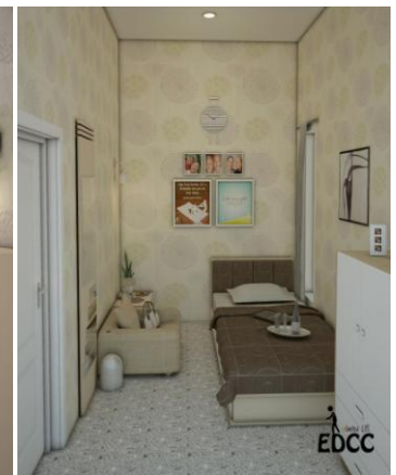
Gambar. 11. Single bedroom