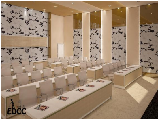
Gambar. 9. Ballroom

Vinyl memiliki klasifikasi untuk penyerapan suara, contohnya seperti area hall , ballroom , dan theater , dipilih yang mampu menyerap suara paling maksimal hingga 19 dB. Material akustik pada plafon erat kaitannya dengan penggunaan pada area ballroom dan theater yang memiliki tingkat kebisingan suara di dalam ruang tertinggi. Panel bagian atas yang agak dimiringkan sangat penting. Hal ini sangat berpengaruh dalam mengatur pemantulan suara sehingga bunyi tidak hilang dan dapat tersebar dengan baik. Panel akustik ini dapat terapkan pada bagian dinding maupun pada bagian furnitur, yaitu salah satunya pada bagian meja untuk area ballroom . Bahan yang digunakan berupa acoustic foam yang dilapisi dengan bahan fabric .