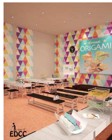
Gambar 5. Creativity room

Karakter warna hangat utama yang digunakan adalah warna cream dan putih. Sementara untuk sentuhan warna-warna yang kuat menggunakan warna-warna cerah. Gaya yang digunakan adalah eklektik, yaitu pencampuran antara gaya modern minimalis dan pop. Hal ini dapat dilihat salah satunya dari ruang creativity room di bawah ini.