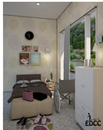
Gambar 10. Couple bedroom

Pada bagian kamar tidur dibagi menjadi 2 area berbeda yaitu single bedroom dan couple bedroom .