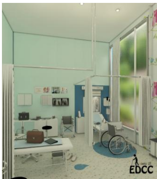
Gambar 6. Medical room EDCC

Jenis pintu yang digunakan yaitu adalah pintu panel dan pintu kaca yang umumnya memiliki konstruksi kaca tempered setebal 13 hingga 19 mm dengan sambungan ke engsel tetap atau perangkat keras lainnya. Sistem pintu yang digunakan yaitu pintu ayun. Pintu ayun ini memiliki engsel kusen samping, paling nyaman untuk pintu masuk dan jalur masuk, dan tipe paling efektif untuk mengisolasi suara dan untuk kedap cuaca. Jenis jendela yang digunakan berupa jendela yang dapat dibuka dan jendela mati yaitu tertutup. Salah satu peneratan jendela tertutup ini difungsikan khusus hanya untuk memasukkan cahaya, salah satunya yaitu medical room .