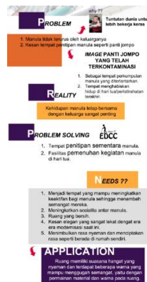
Gambar. 3. Konsep perancangan

Konsep desain yang dipakai dalam perancangan Elderly Day Care Center (EDCC) ini adalah “Kampus Orangtua”, yang mencirikan tujuan utama dari perancangan ini yaitu menjadi wadah pembelajaran bagi manula untuk dapat belajar hal-hal baru, tetap beraktivitas aktif, bersosialisasi, dan menghasilkan karya-karya di usia yang sudah terhitung lanjut usia.