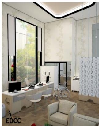
Gambar 7. Office

Aksesoris seperti roller blind dan gordyn juga dapat dimanfaatkan sebagai penghalang masuknya sinar matahari panas saat siang hari. Pencahayaan buatan digunakan saat sore menjelang malam hari dimana aktivitas EDCC dimulai dari pukul 07.30-16.30, sehingga pencahayaan buatan tidak terlalu banyak digunakan. Pencahayaan buatan terdiri dari lampu utama yaitu downlight LED dan lampu tambahan seperti spotlight dan hidden lamp (menggunakan LED strip ). Pencahayaan lampu tambahan berguna untuk memberikan aksesoris dan suasana tertentu di dalam ruang. Contoh penerapan roller blind dan hidden lamp terdapat pada ruang office .