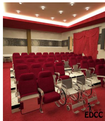
Gambar 8. Theater

Dinding yang bersiku akan lebih memantulkan bunyi. Selain itu material dinding yang dapat digunakan yaitu karpet, penerapan gordyn dan roller blind pada beberapa area, contohnya office , theater , dll. Material akustik lantai diterapkan dengan menggunakan material vinyl dan karpet yang nyaman dan cocok untuk healthcare . Vinyl, karpet, dan material permukaan lunak lainnya lebih mampu menyerap suara dibandingkan material dengan permukaan kasar. Penerapan vinyl terlihat pada gambar ruang theater .