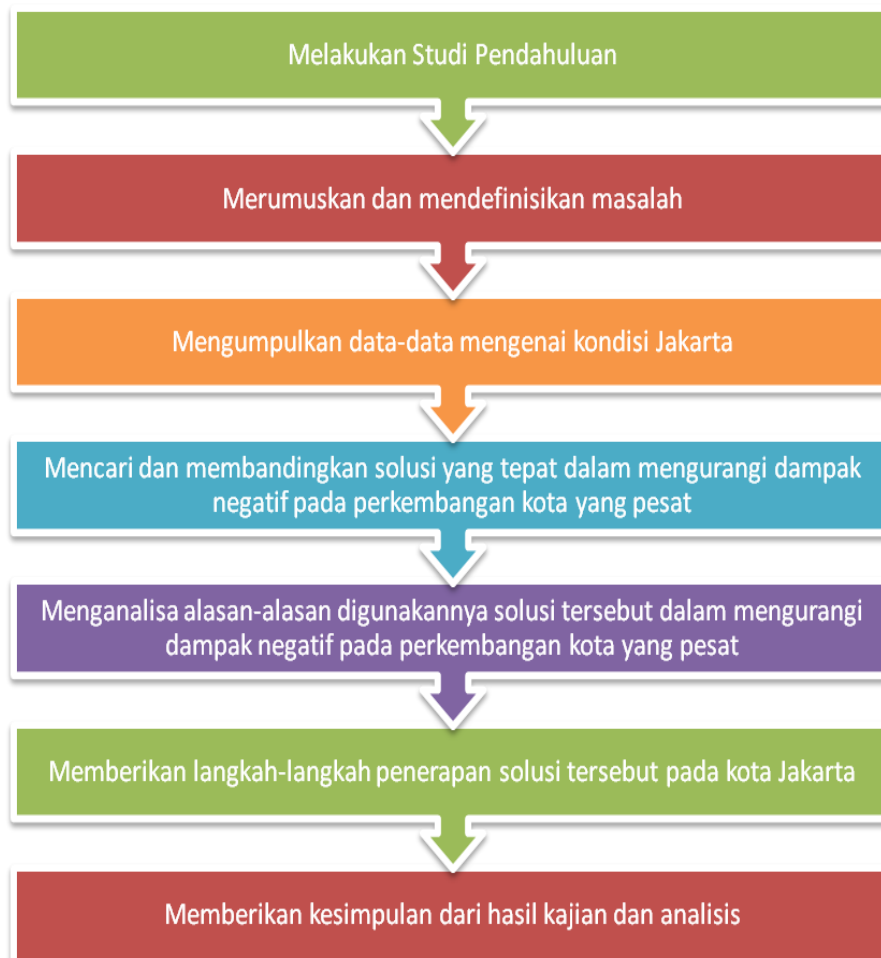
Gambar 1 Langkah-langkah Pembahasan

Berikut langkah-langkah yang diperlukan dalam melakukan studi mengenai masalah yang terkait. Langkah-langkah pembahasan seperti gambar 1.