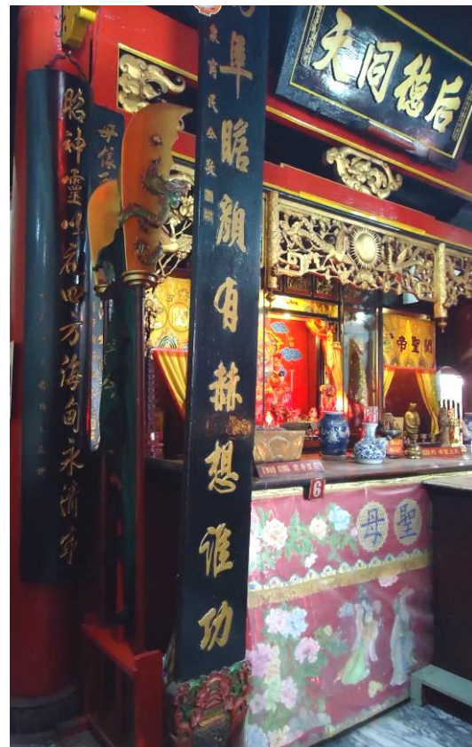
Gambar. 10. Replika Kwan Dao di samping kiri meja altar Dewa Kwan Kong urutan nomor enam (6).