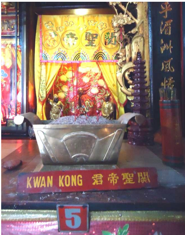
Gambar. 5. Meja altar kim shin Dewa Kwan Kong urutan nomor lima (5).

Meja pertama (lihat gambar. 5.) merupakan bagian dari altar karena berfungsi untuk meletakkan papan nama Dewa Kwan Kong yang berbentuk persegi panjang berwarna dasar merah tua diberi tulisan Kwan Kong dengan huruf latin di sisi kiri dan aksara Tiongkok (君帝聖關) di sisi kanan, berwarna kuning sehingga memperlihatkan kembali paduan warna yang kontras secara visual bertujuan memberi informasi bagi para umat. Namun para umat