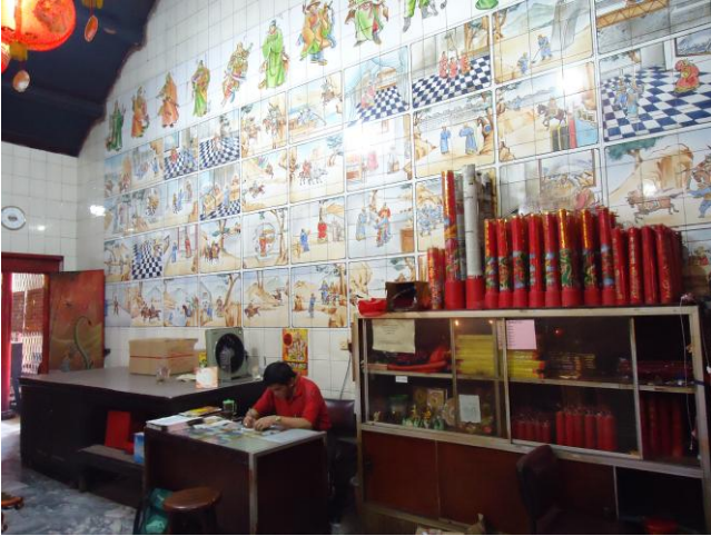
Gambar. 8. Tampak sisi kanan dinding ruang altar utama dari sudut pandang pintu masuk ruangan.

Elemen pembentuk ruang yaitu dinding ruang altar utama klenteng. Pada awal pembangunan ruang altar utama klenteng, material dinding berupa batu bara merah dengan campuran batu gamping dengan bahan perekat. Menurut juru kunci klenteng atau bio kong , ada seorang umat klenteng yang menyumbangkan material penutup dinding berupa keramik beserta jasa pemasangannya ke dinding ruang altar utama klenteng. Keramik ini bukan keramik biasa karena telah dibuat khusus, dengan bagian permukaannya digambar secara manual. Gambar tersebut bercerita tentang kisah riwayat Dewa Kwan Kong di masa tiga kerajaan (San Guo). Kisah yang digambarkan pada keramik dinding tersebut tidak secara keseluruhan dari awal hingga akhir riwayat Dewa Kwan Kong di masa tiga kerajaan, tetapi hanya sepinggal kisah saja.