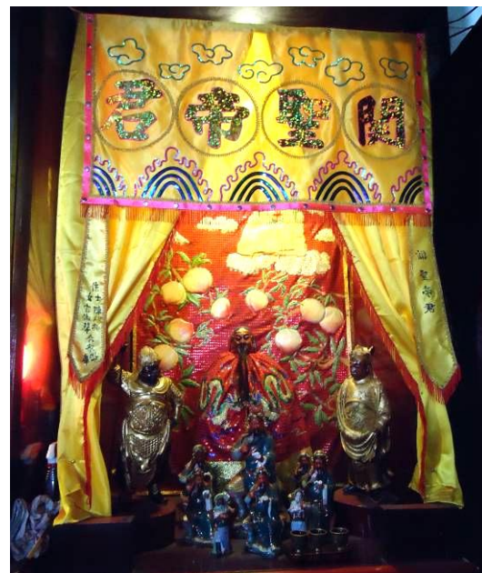
Gambar. 3. Altar kim shin Dewa Kwan Kong urutan nomor lima (5). dengan warna kuning warm white , sehingga memberikan suasana temaram secara visual.

motifnya yang berupa serat kayu. Ukuran kedua altar Dewa Kwan Kong berukuran lebih kecil dibandingkan altar Dewi Mahcoh Po yang berada di tengah. Namun kedua altar ini juga didekorasi dengan baik, dapat terlihat pada kain penutup bagian muka altar lebih ditonjolkan dibandingkan dengan kain altar Dewi Mahcoh Po. Kain penutup bagian muka kedua altar bernuansa kuning cerah dilengkapi empat aksara Tiongkok berwarna emas dibordir di bagian tengah kain, kedua kombinasi warna ini terlihat kontras secara visual. Altar-altar patung Dewa Kwan Kong dan Mahcoh Po diberi sumber cahaya buatan yaitu lampu TL standar