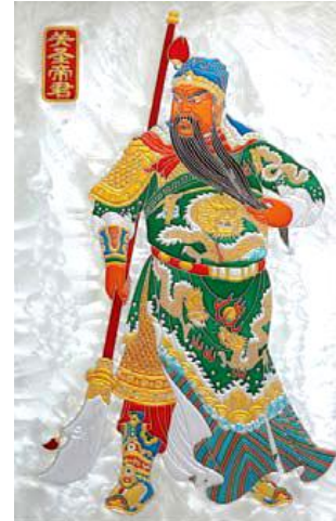
Gambar. 9. Kwan Kong memegang golok “Naga Hijau Mengejar Rembulan”.

Elemen pengisi ruang adalah aksesori berupa replika senjata Dewa Kwan Kong yang terletak di sisi samping kiri area altar Dewa Kwan Kong yang bernomor urut enam (6). Replika senjata ini berdasarkan representational meaning berhubungan dengan Kwan Kong, karena semasa hidupnya ia berprofesi sebagai panglima perang yang memiliki senjata khas berupa golok dengan pegangan tongkat panjang yang menurut [11] disebut Kwan Dao (關刀 berarti golok Kwan) dan bernama “Naga Hijau Mengejar Rembulan”. Senjata ini juga sering digambarkan pada