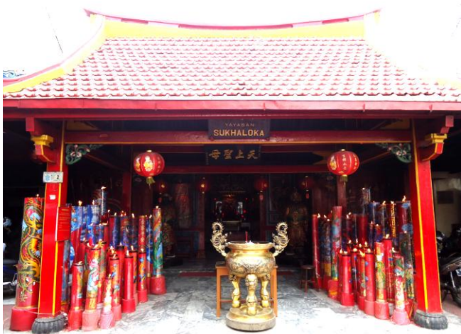
Gambar. 1. Tampak muka halaman depan Klenteng Hok An Kiong Surabaya.

desain lebih mengutamakan makna atau isi dari sebuah karya. Pengertian lain menyatakan ikonografi dapat mengungkapkan “cerita” dari gambar yang dibuat oleh seniman atau desainer [4]. Penelitian ikonografi akan di fokuskan kepada kim shin Dewa Kwan Kong karena posisinya sebagai dewa pendamping kurang dipelajari secara mendalam di Klenteng Hok An Kiong Surabaya. Hasil penelitian ikonografi tersebut akan membantu dalam mengungkapkan perwujudan elemen-elemen desain interior maupun fakta-fakta lain yang berkaitan langsung dengan Kwan Kong pada ruang altar utama Klenteng Hok An Kiong Surabaya.