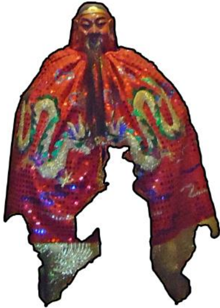
Gambar. 7. Kim shin Dewa Kwan Kong yang asli.

Pertama-tama akan dijelaskan kim shin Dewa Kwan Kong yang akan dianalisa, karena di kedua altar Dewa Kwan Kong masing-masing terdapat lebih dari satu kim shin dewa. Ciri khas pertama secara visual kim shin Dewa Kwan Kong yang asli berukuran paling besar diantara kim shin-kim shin dewa lainnya. Ciri-ciri kedua wajahnya berwarna merah hati, ciri-ciri ketiga berjenggot panjang. Ciri-ciri keempat badan patung ditutupi pakaian menyerupai jubah yang menutupi leher hingga kaki dan berwarna dominan merah. Jubah tersebut diberi motif dua naga khas Tiongkok berwarna emas pucat yang saling bertatap muka di tengah jubah. Secara visual hal ini memberikan perbedaan yang kontras diantara kim shin-kim shin dewa lainnya yang terutama dari segi ukuran dan warna.