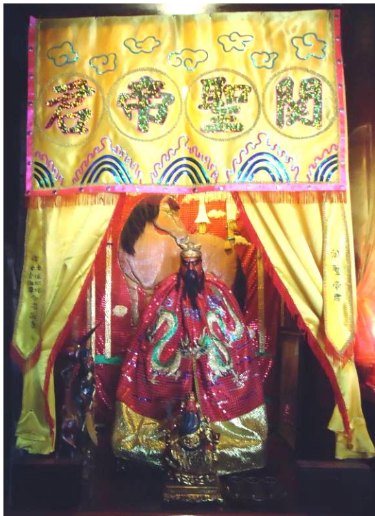
Gambar. 4. Altar kim shin Dewa Kwan Kong urutan nomor enam (6).

Meja pertama (lihat gambar. 5.) merupakan bagian dari altar karena berfungsi untuk meletakkan papan nama Dewa Kwan Kong yang berbentuk persegi panjang berwarna dasar merah tua diberi tulisan Kwan Kong dengan huruf latin di sisi kiri dan aksara Tiongkok (君帝聖關) di sisi kanan, berwarna kuning sehingga memperlihatkan kembali paduan warna yang kontras secara visual bertujuan memberi informasi bagi para umat. Namun para umat