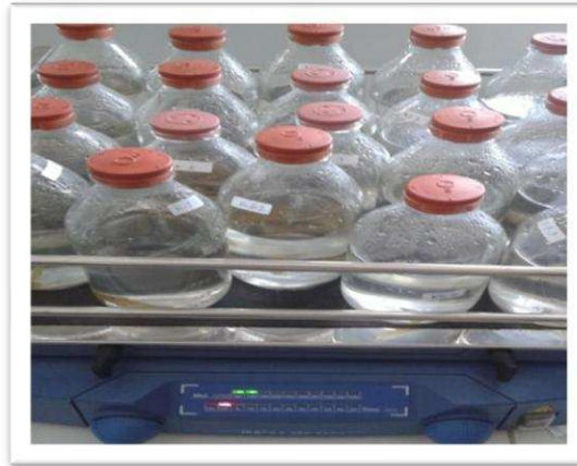
Gambar 1. Wadah pemeliharaan rumput laut E. cottonii selama penelitian

Tahap pemeliharaan E. cottonii meliputi penyiapan rumput laut, penyiapan kultur bakteri, inokulasi konsorsium bakteri K1, K2 dan K3 dengan konsentrasi bakteri sesuai perlakuan, pengamatan gejala klinis yang ditimbulkan, dan monitoring kualitas air. Perhitungan nilai pertumbuhan dilakukan di awal dan akhir penelitian, perhitungan kepadatan bakteri dilakukan pada hari 1, 3, 6 dan 9.