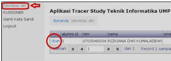
Gambar 12. Identitas Diri

Alumni juga diminta mengisi data identitas diri pada Gambar 12 untuk memudahkan dalam pembangunan jaringan alumni. Masuk ke menu “Identitas Diri” lalu klik link “Ubah”.