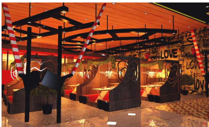
Gambar 8. Kereta Api Besar