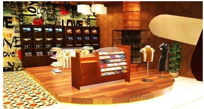
Gambar.3. Area Merchandise

Konsep dari desain magnum kafe ini adalah Theme Park . Theme Park merupakan tempat hiburan yang seru dan menyenangkan. Tempat ini penuh dengan teknologi. Hal tersebut ingin diwujudkan dalam perancangan magnum kafe ketika makan es krim merasakan suasana yang senang dan ceria. Pengaplikasian dari konsep ini diwujudkan dalam 3 wahana, yang pertama wahana kereta, lalu wahana pelabuhan dan wahana kerajaan. Ketiga wahana ini merupakan inspirasi dari wahana yang ada di Theme Park . Meskipun theme park yang suasananya penuh kegembiraan yang digambarkan dengan colourfull tetapi tetap menggunakan warna glamour dari es krim magnum. Hal tersebut menghindari hilangnya identitas kafe magnum. Teknologi yang dipakai pada magnum kafe berupa layar LED, lantai LED, dan efek-efek untuk mendukung 3 wahana tersebut.