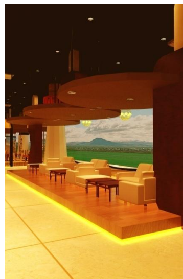
Gambar.11. Area Sofa

Area ini dibuat menyerupai pelabuhan tetapi memang disiapkan hanya untuk dua orang saja. Lebih cocok bagi orang-orang yang datang berpacaran. Karena salah satu di area ini ada perahu kecil yang juga dapat digunakan untuk tempat makan. Untuk menyerupai berjalan didalam air, bagian lantai diberi LED TV dengan tekstur air.