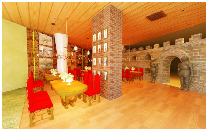
Gambar.13. Wahana Castle

Area sofa posisinya berada di samping area bar. Area ini dapat digunakan sebagai area bersantai bagi pengunjung.