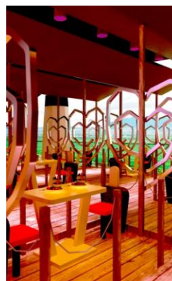
Gambar.9. Wahana Pelabuhan