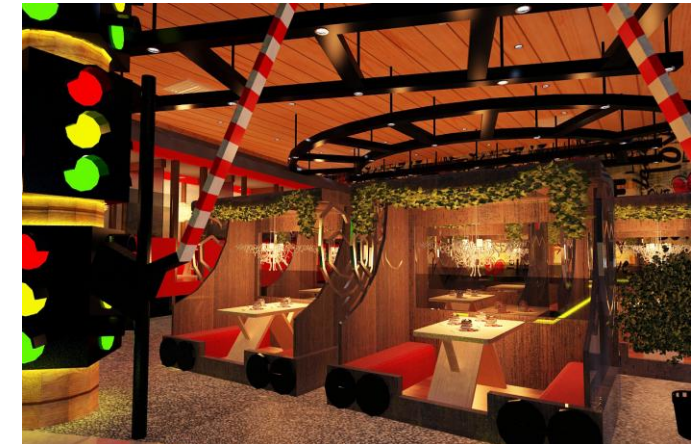
Gambar.5. Wahana Kereta

Area ini berada tepat di dekat pintu masuk kafe. Tujuannya ketika pengunjung sudah selesai makan dan ingin pulang dapat datang dahulu ke tempat ini untuk membeli pernak-pernik atau bahan membuat es yang telah disediakan.