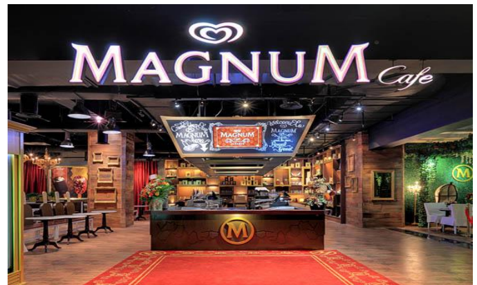
Gambar. 1. Magnum Kafe yang berada di Mall Indonesia Jakarta.

Es krim magnum merupakan produk dari es krim Walls milik Unilever. Es krim ini semenjak diluncurkan menjadi es krim yang disukai oleh banyak orang. Es krim ini juga membuka kafe yang dikenal dengan Magnum Kafe di kota Jakarta. Magnum kafe berada di Mall Indonesia di Jakarta.