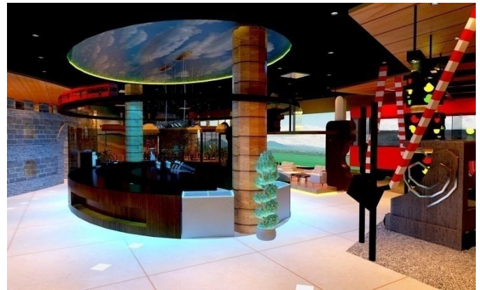
Gambar.4. Area Bar