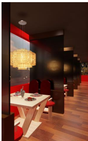
Gambar.7. Kereta Api Besar

Area Wahana Kereta dibagi menjadi 2 bagian. Yang pertama kereta kecil dan yang kedua adalah kereta besar yang dibuat menyerupai gerbong kereta. Merupakan salah satu fasilitas pengunjung yang akan makan.