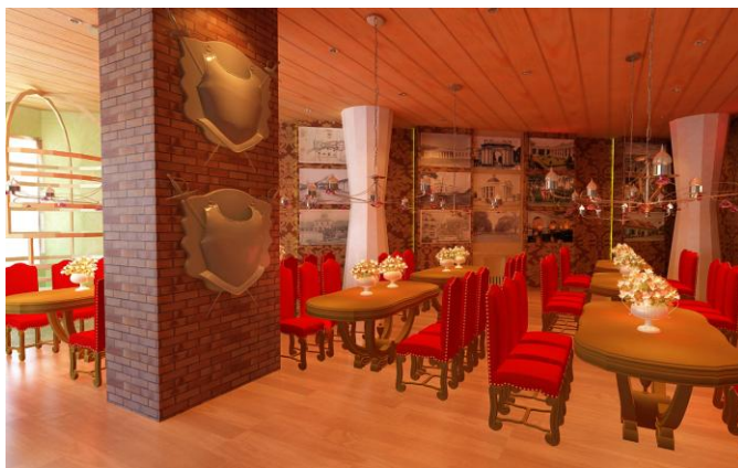
Gambar.12. Wahana Castle