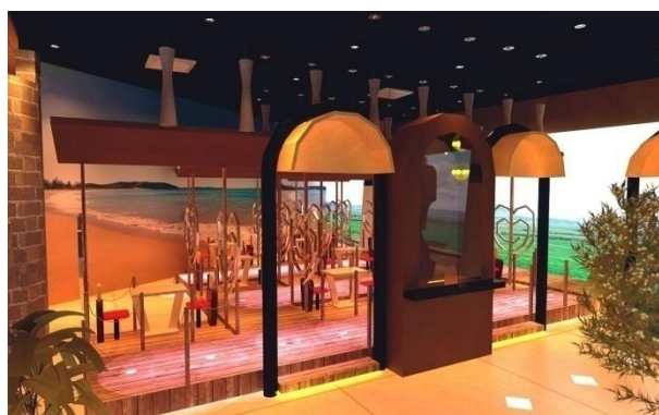
Gambar.8. Wahana Pelabuhan

Area sofa ini disiapkan bagi para pengunjung yang ingin bersantai meminum es krim sambil mendengarkan alunan music. Tidak hanya itu, pengunjung yang duduk di area ini juga dapat melihat langsung ke arah area bar karena area bar merupakan open kitchen sehingga dapat melihat langsung para koki yang sedang membuat pesanan para pengunjung.