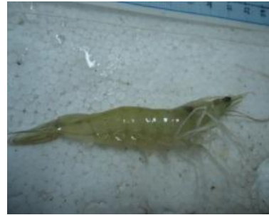
Gambar 2. Perubahan Kondisi Udang Pasca Perendaman

menunjukkan pemulihan ke arah morfologi normal pada hari ke-3 pasca perendaman dan gejala klinis tidak terdeteksi lagi pada hari ke-6 pasca perendaman (Gambar 2).