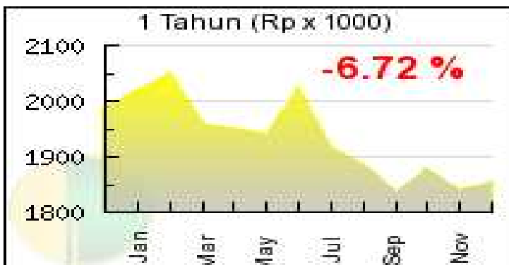
Grafik Perkembangan Harga Dinar Pada Tahun 2014

Dalam hitungan per tahun, harga dinar (1 dinar ekuivalen dengan 4,25 gram) ditetapkan pada harga mendekati Rp.2.000.000 pada awal januari tahun 2014, dan pada bulan Februari harganya sempat menembus level Rp.2.050.000, namun setelah itu harga dinar terus menurun hingga menembus level Rp.1.850.000 pada akhir tahun 2014, sehingga tingkat penurunan harga dinar telah mencapai 6,72% sebagaimana yang terlihat pada grafik dibawah ini