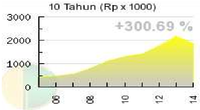
Grafik Perkembangan Harga Dinar Selama 10 Tahun

kenaikan harganya yang tidak begitu signifikan dalam jangka pendek, emas akan lebih tepat jika dipergunakan untuk investasi dalam waktu lebih dari tiga atau bahkan enam bulan, hal ini bisa kita lihat pada grafik dibawah ini.