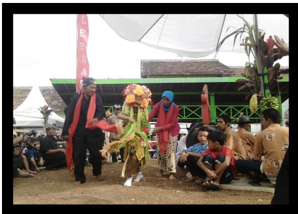
Penari bersama Pêngundang dan Pendamping

transformasi subjek mengalami proses alih wahana atau berubah menjadi „peran yang lain“. Ritual yang diteliti oleh Turner bukanlah suatu upacara di mana subjek ritualnya mengalami keadaan trance artinya subjek tetap sebagai dirinya sendiri secara sadar, sehingga tahap transformasi tidak ditemukan dalam proses ritual Turner. Skema ritual Sêblang digambarkan berbentuk spiral karena proses ritual separasi, liminalitas, dan transformasi terjadi berulang-ulang dan berjalan terus menerus tanpa terputus selama tujuh hari.