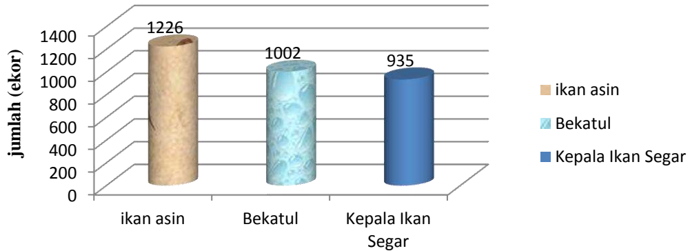
Gambar 2. Perbandingan Jumlah Berat Hasil Tangkapan Udang Galah ( Macrobracium idae )

Pada gambar 2 menunjukkan bahwa perlakuan I (bubu bambu berumpan ikan asin) lebih banyak menghasilkan tangkapan udang Galah ( Macrobracium idae ) dibanding dengan hasil tangkapan dari perlakuan II dan III. Pada perlakuan I dengan menggunakan ikan asin didapat hasil tangkapan udang galah ( Macrobracium idae ) sebanyak 1.226 ekor sedangkan untuk perlakuan II dan III menghasilkan udang galah ( Macrobracium idae ) sebanyak 1.002 ekor dan 935 ekor.