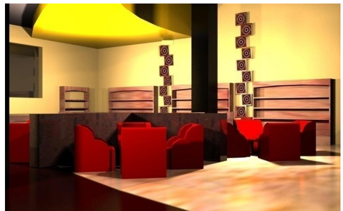
Gambar 4. Perspektif Lobby di Hotel Allson City

Lobby merupakan bagian utama yang menjadi wajah hotel tersebut. Sebuah lobby sebaiknya dirancang dengan lapang yang dapat terhubung secara visual dan fisik ke area rekreatif. Perancangan sebuah lobby tidak hanya