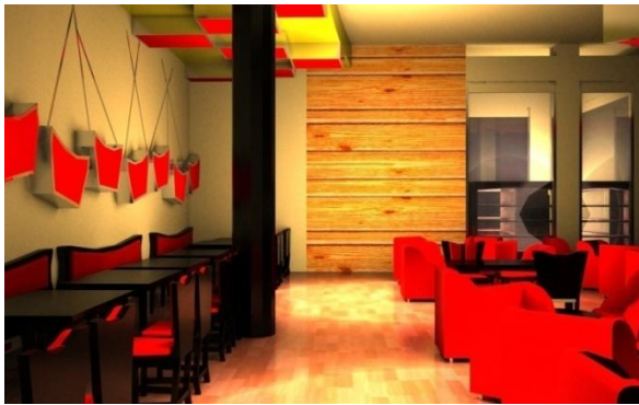
Gambar 7. Perspektif Area Café di Hotel Allson City

Secara umum kafe merupakan suatu tempat yang menyediakan makanan dan minuman yang menyerupai restoran dalam sistem pelayanan pengunjung, yang dapat digunakan sebagai tempat santai dan ngobrol sampai dihibur oleh alunan music. Kafe cenderung mengutamakan hiburan yang disajikan dan kenyamanan pelanggan dalam menikmati hidangan maupun rasa dan variasi menu yang diutamakan [4].