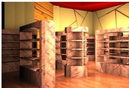
Gambar 6. Perspektif Area Shop di Hotel Allson City

Pengaplikasian warna kayu yang hangat, serta warna hitam dan merah sebagai aksen pada ruang resepsionis memberikan kesan nyaman dan hangat bagi pengunjung.