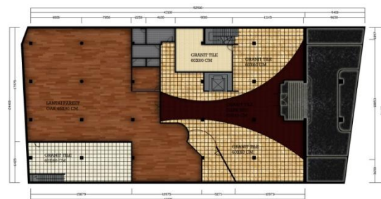
Gambar 3. Pola Lantai Lobby, Art & Craft Café di Hotel Allson City

Perancangan ini menggunakan pola sirkulasi linear bercabang dengan satu pintu masuk dan keluar. Setelah melewati pintu masuk, maka alur sirkulasi akan menyebar sesuai dengan tujuan pengunjung. Area ruangan dikelompokkan dengan menyesuaikan alur pengguna, sehingga seluruh ruang dapat diakses oleh pengguna ruang.