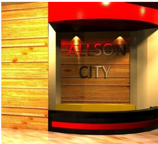
Gambar 5. Perspektif Area Receptionist di Hotel Allson City

Pada area lobby perancangan ini, penggunaan material-material seperti kayu, stainless , dan warna-warna yang mencerminkan ciri khas budaya Toraja yaitu hitam, merah, kuning dan putih. Mengaplikasikan ukiran khas budaya Toraja yang dikemas dengan stainless sehingga terlihat lebih modern.