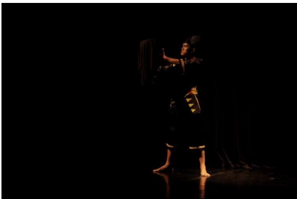
Gambar 1. Salah seorang penari dengan membawa omprog pada adegan introduksi

Berikutnya muncul lagi lima penari dengan gerak yang keras dan tegas. Hal tersebut menggambarkan para laki-laki yang gagah dan akan bersiap menjadi penari Gandrung. Selanjutnya para penari menuju ke kiri panggung dengan gerak yang pelan dan terkomposisikan sampai akhirnya berjalan menuju backdrop untuk bersiap-siap untuk ritual pemakaian omprog .