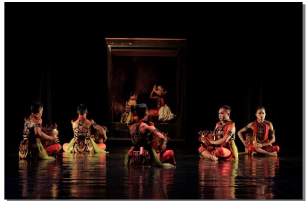
Gambar 2. Adegan ritual pemakaian omprog (dok. Ikeldiyo Art, 2016)

Adegan 1 dimulai dengan adanya ritual pemakaian omprog . Omprog merupakan mahkota yang wajib digunakan oleh penari Gandrung. Dalam nyatanya, setiap penari Gandrung memiliki ritualnya masing-masing dalam memakai omprog . Adegan 1 ini ritual pemakaian omprog dilakukan oleh dua orang penari yang berada dibelakang backdrop . Kedua penari melakukan gerakan doa terlebih dahulu dengan terdapat sesaji dan omprog pastinya. Adegan 1 ini pada dasarnya merupakan jejeran atau memperlihatkan kemampuan penari Gandrung. Dalam hal ini para penari laki-laki menarikan tari perempuan dan berperan sebagai perempuan.