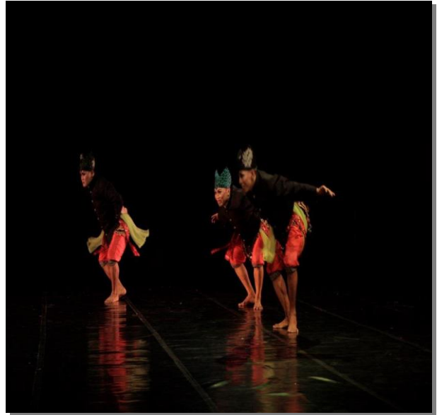
Gambar 5. Adegan penari laki-laki yang masuk dalam adegan ketiga

Setelah penari yang berperan sebagai perempuan keluar panggung, tinggal para penari laki-laki. Penari melakukan gerak yang lebih maskulin dengan volume yang besar dan tegas. Setelah itu terdapat sedikit peralihan ke gerak yang perempuan, kemudian black out dan penari keluar.