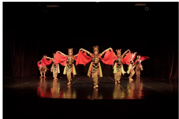
Gambar 3. Adegan satu yaitu adegan jejeran