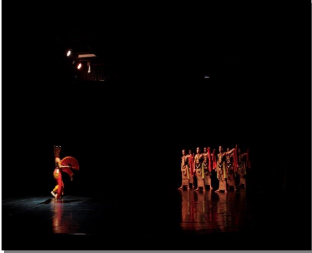
Gambar 6. Adegan terakhir ketika penari laki-laki melepas sampur dan melihat ke arah penari perempuan ( dok. Ikeldiyo Art, 2016 )