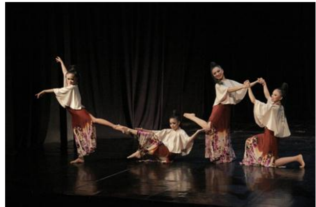
Gambar 4 : Visualisasi hubungan sosial antar sesama teman dan lingkungan pada bagian satu

masyarakat dengan masing-masing kebutuhannya digambarkan dalam bagian ini. Dimulai dengan gerak rampak yang dilakukan oleh empat orang penari dengan pola lantai segi lima sebanyak empat kali delapan. Kemudian melakukan gerak transisi sebanyak satu kali delapan hingga membentuk pola lantai satu garis lurus vertical di death center menghadap penonton dengan jarak dekat antara satu dengan yang lainnya.