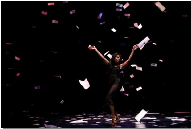
Gambar 3 : Formasi pada bagian Ending dengan setting berupa uang mainan dan kertas yang dijatuhkan dari stage bagian atas

ketika memutuskan untuk terjun ke dunia malam mengambil profesi sebagai penari klub malam. Keduanya turun secara bergantian, sebagai perwujudan desakan tuntutan yang harus dipenuhi dalam waktu yang singkat.