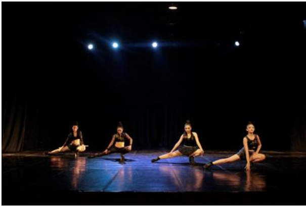
Gambar 5 : Visualisasi wanita-wanita yang berprofesi sebagai penari klub malam pada bagian dua