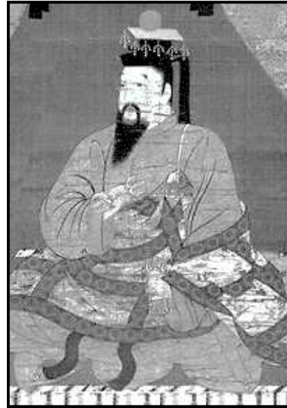
Gambar 2. Ilustrasi Kaisar Go-Daigo

Kaisar Go-Daigo berencana untuk menggulingkan Keshogunan Kamakura pada tahun 1324 dengan bantuan Hino Suketomo (1290-1332) dan Hino Toshimoto (?-1332) (Frédéric, 2002:877). Rencana ini diketahui oleh Rokuhara Tandai dan peristiwa ini dikenal dengan Insiden Shochu ( Shochu no Hen ). Tahun 1331, Go-Daigo kembali menjalankan rencananya untuk menghancurkan Kamakura, tetapi kali ini Go-Daigo kembali dikhianati oleh rekannya, Yoshida Sadafusa (Sansom, 1958:481). Go-Daigo diasingkan di Okino Shima , yang merupakan tempat yang sama dimana Kaisar Go-Toba sebelumnya diasingkan. Akan tetapi, berbeda dengan Go-Toba, tidak lama setelah diasingkan, Go-Daigo berhasil melarikan diri dan menghimpun dukungan di bagian Barat Honshu (Henshall, 2012:40).