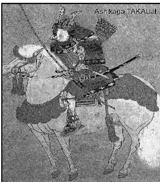
Gambar 4. Ilustrasi Ashikaga Takauji

Pertempuran dimulai pada 1331 dimana Keshogunan memaksa Go-Daigo untuk turun tahta. Pada awalnya, Go-Daigo mengalami kekalahan, sehingga ditangkap dan diasingkan di Okino Shima . Akan tetapi, Bakufu kewalahan dengan prajurit-prajurit koalisi yang dihimpun oleh Go-Daigo dan pada 1332, Go-Daigo berhasil melarikan diri dari pengasingannya. Go-Daigo kembali ke Kyoto dengan kemenangan, tetapi tidak lama kemudian pada 1336, Ashikaga Takauji (1305-1358) yang merupakan panglima Bakufu mengirimkan pasukan untuk menghancurkan Go-Daigo. Nitta Yoshisada (1301-1338) yang merupakan prajurit sekutu Go-Daigo menaklukkan Kamakura dan berhasil mengakhiri kekuasaan Hojo.