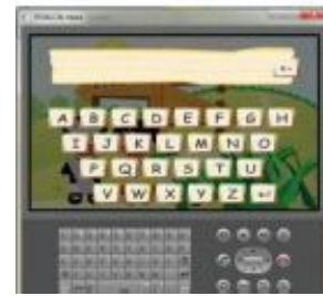
Gambar 4. Tampilan Input Nama