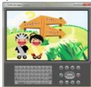
Gambar 3. Tampilan Menu Mulai