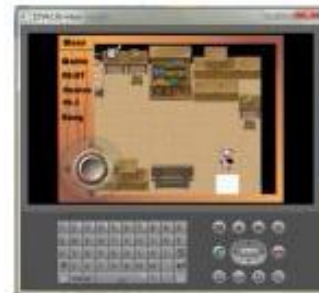
Gambar 6. Tampilan Permainan