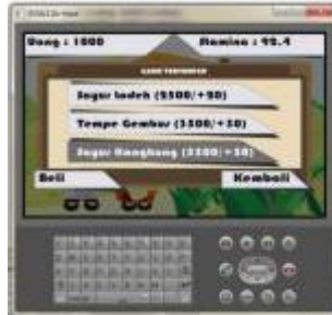
Gambar 8. Tampilan Menu Toko Makanan