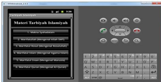
Gambar 4. Tampilan Menu Materi Tarbiyah Islamiyah

Menu materi tarbiyah islamiyah adalah menu yang berisi beberapa pilihan materi-materi tarbiyah islamiyah, seperti : Makna Syahadatain, Ma'rifatullah (Mengenal Allah SWT), Ma'rifatul Rasul (Mengenal Rasulullah), Ma'rifatul Islam (Mengenal Agama Islam), Ma'rifatul Insan (Mengenal Manusia), dan Ma'rifatul Quran (Mengenal Al -Quran). Tampilan Materi Tarbiyah Islamiyah tersebut dapat di lihat pada gambar 4.