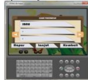
Gambar 5. Tampilan Lanjutkan Permainan