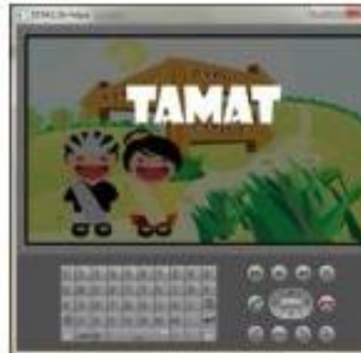
Gambar 9. Tampilan Tamat