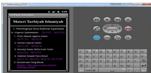
Gambar 6. Tampilan Isi Sub Materi Tarbiyah Islamiyah

6. Tampilan Isi Sub Materi Tarbiyah Islamiyah Tampilan isi sub materi ini adalah sebuah ringkasan dari setiap sub materi-materi yang berkaitan dengan materi intinya, yang penjelasan dan pembahasannya berdasarkan al-quran dan al-hadits. Sebagai contoh sub materi yang digunakan adalah sub materi "Makna Syahadatain". Salah satu tampilan isi sub materi tersebut dapat dilihat pada gambar 6.