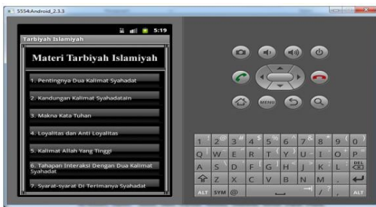
Gambar 5. Tampilan Sub Materi Tarbiyah Islamiyah

Menu sub materi tarbiyah islamiyah adalah menu yang berisi beberapa sub materi dari setiap materi-materi yang terdapat pada menu materi tarbiyah islamiyah. Salah satu tampilan sub materi tarbiyah islamiyah tersebut dapat dilihat pada gambar 5.