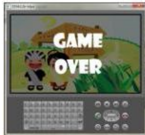
Gambar 10. Tampilan Game Over