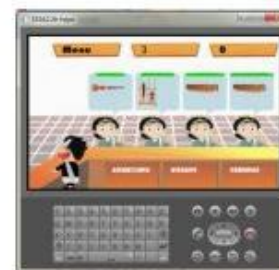
Gambar 7. Tampilan Toko Alat Musik