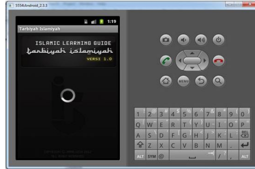
Gambar 1. Tampilan Splash Layout

ke dalam menu utama. Gambar 1 berikut menampilkan tampilan yang akan muncul pertama kali saat mengaktifkan aplikasi media pembelajaran “Tarbiyah Islamiyah” secara mandiri berbasis android OS.