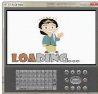
Gambar 1. Tampilan Loading