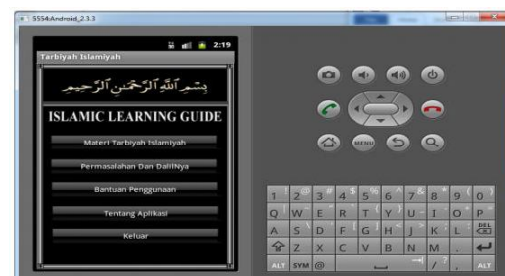
Gambar 3. Tampilan Main Menu

Main menu adalah menu utama yang di dalamnya terdapat menu-menu pilihan, yaitu : Materi Tarbiyah Islamiyah, Permasalahan dan Dalilnya, Bantuan Penggunaan, Tentang Aplikasi dan Tarbiyah Islamiyah, dan Menu Keluar. Menu ini berfungsi sebagai navigasi untuk menuju halaman-halaman lain. Tampilan Main Menu tersebut dapat dilihat pada gambar 3.