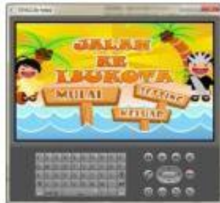
Gambar 2. Tampilan Menu Utama