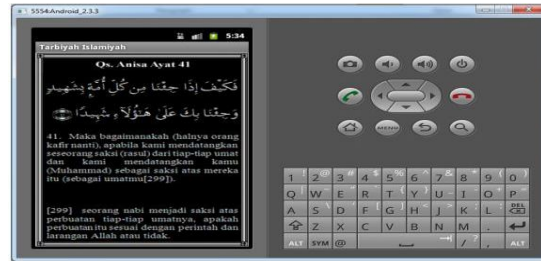
Gambar 7. Tampilan Al-Quran dari Isi Sub Materi Tarbiyah Islamiyah

Pada halaman ini aplikasi akan menampilkan al-quran atau al-hadits yang tertera pada isi sub materi tarbiyah islamiyah apabila di klik ataupun disentuh. Salah satu tampilan al-quran atau al-hadits dari isi sub materi tersebut ketika di klik ataupun disentuh dapat dilihat pada gambar 7.