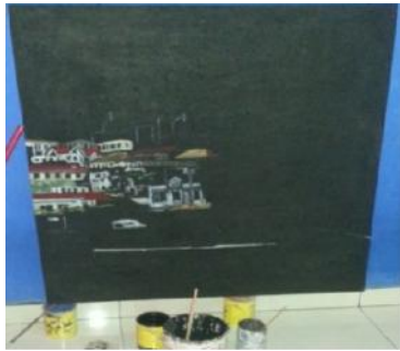
Gambar 8. Mendasar kanvas dengan cat kappie di campur nodrop.