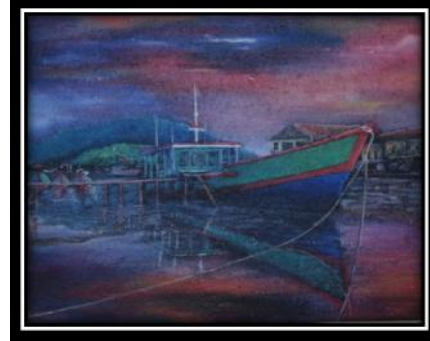
Gambar 3. Tinjauan Karya III Judul: Sungai Batang Arau, 90cm×100cm, Media : Mix Media Tahun : 2013

tersendiri, apa lagi ada refleksi langit dan cahaya matahari.