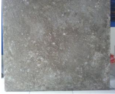
Gambar 7. Pasir di atas kanvas campur dengan cat kappie dan nodrop.