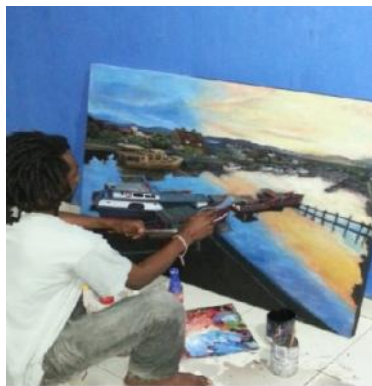
Gambar 9 Proses melukis.