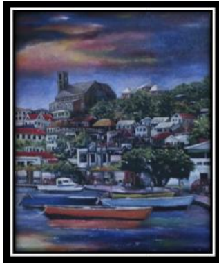
Gambar 2. Tinjauan Karya II Judul: The hill, 100cm×130cm, Media: Mix Media Tahun: 2013

Karya ini menceritakan keramaian dengan banyak rakyat dan rumah yang ada di sekitar kota. Visual warna hijau pada pohon pada karya ini menceritakan bahwa kenyamanan dan keasrian kota. Visual warna hijau pada pohon pada karya ini menceritakan bahwa kenyamanan dan keasrian kota, Visual kota dengan warna dan berbagai kombinasi warna pada karya ini adalah bahwa kota ini memiliki keindahan, ketenangan dan kenyamanan.