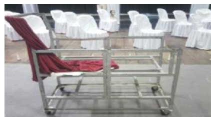
Foto Rias dan Busana yang digunakan.