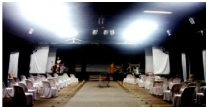
Gambar 4. penataan Pentas (Foto: Yuditia Leo Andhika, 2010)