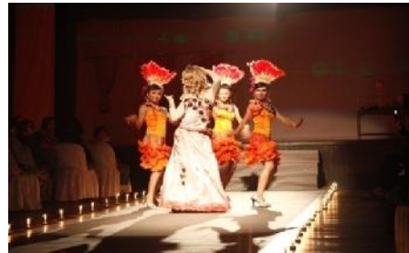
Gambar 5. Pertunjukan Aku dan Sekujur Manekin

tidak ideal. Disaat itulah manekin-manekin bergerak menertawakannya. Suasana tenang, dengan durasi 10 menit, kostum yang di gunakan mewakili dunia fashion.