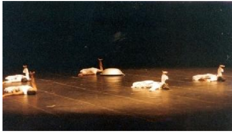
Gambar 6. Gerakan Penari Bagian Ketiga

beberapa titik fokus, kemudian memadukan cahaya back light dan general untuk menciptakan suasana penutup.