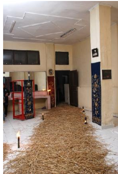
Gambar 3. Ruang menuju Teater Arena (Foto: Antoni Putra, Desember 2010)

Pemusik Sijobang selesai Basijobang dan mulai memukul momongan, MC membacakan sinopsis karya. Among Tamu mengarahkan penonton untuk memasuki Gedung Teater menuju Pentas Arena Mursal Esten, sepanjang perjalanan ke dalam dipasang enam buah obor panjang dan momongan juga mengantar penonton sampai ke pentas. Namun, dalam sebuah ruangan menuju pentas di dinding-dindingnya terpajang foto-foto proses karya “Pilihan Andami”.