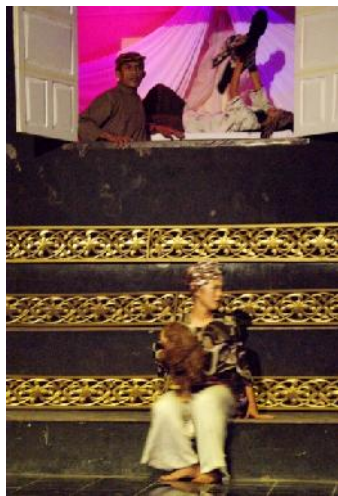
Gambar 4. Bagian Kedua: “Api Percintaan” (Foto: Asril Muchtar, Desember 2010)

menampilkan adegan Gondorih dan Anggun. Gondorih menghadapi penyakitnya berkehendak agar Anggun mencarikan boneka buatan tangan. Pemilihan boneka sebagai pengganti burung nuri bisa bicara, sebab ditampilkannya karya tari ini pada zaman ‘sekarang’ agar terlihat lebih realistis penggambarannya, maka Andami ‘masa kini’ memiliki boneka buatan tangan bukan burung nuri bisa bicara.