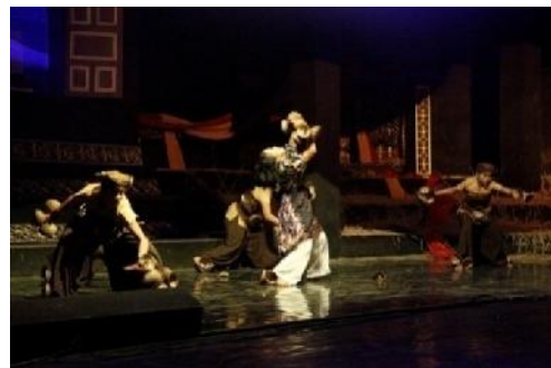
Gambar 5. Bagian Ketiga: “Gelombang Perjuangan”

menghadapi kenyataan, dan juga perjuangan Andami memperoleh suaminya kembali. Properti yang digunakan, yaitu galuak . Galuak sebagai simbol suara hati Andami Sutan, yang diliputi oleh api amarah dan kebencian. Selain itu, pemilihan properti galuak dilakukan agar dalam mengekspresikan teks lama atau klasik ( kaba Anggun Nan Tongga ) tersebut dilakukan dengan “sarana yang membuat sesuatu jadi aneh dan ganjil”, seperti menurut Echo (2009: 395), bahwa untuk mendeskripsikan sesuatu yang sudah pernah dilihat atau dikenal, dengan menggunakan kata-kata (atau tanda-tanda jenis lain) dengan cara yang berbeda.