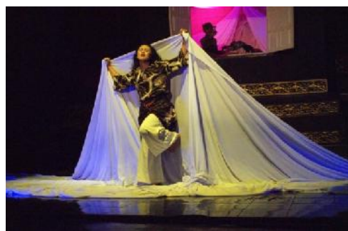
Gambar 6. Bagian Kelima: “Pohon Keikhlasan”

belakang kain dengan gerak melilitkan kain putih ke tubuh dan bergerak berdiri mengeksplorasi kain. Ruang tengah berjendela menampilkan Anggun dengan pose tangan kanan serong dan jari telunjuk ke atas membentuk angka satu (diambil dari gerak tari Sado) yang menyimbolkan sikap Anggun yang ingin kembali ke pelukan istrinya. Namun Andami tidak bergeming dengan terus berjalan ke arah penonton dengan tetap memegang kain sampai menghilang dari pandangan penonton.