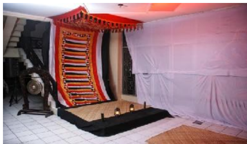
Gambar 2. Pentas Bagian Pertama: Basijobang (Foto: Antoni Putra, Desember 2010)

Pemusik Sijobang selesai Basijobang dan mulai memukul momongan, MC membacakan sinopsis karya. Among Tamu mengarahkan penonton untuk memasuki Gedung Teater menuju Pentas Arena Mursal Esten, sepanjang perjalanan ke dalam dipasang enam buah obor panjang dan momongan juga mengantar penonton sampai ke pentas. Namun, dalam sebuah ruangan menuju pentas di dinding-dindingnya terpajang foto-foto proses karya “Pilihan Andami”.