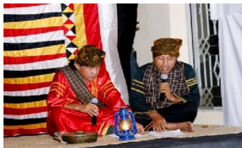
Gambar 1. Basijobang

Musik Sijobang , merupakan nyanyian narasi puitis tentang pahlawan legendaris Anggun Nan Tunga. Selain itu musik Sijobang , adalah bentuk hiburan yang populer di daerah sekitar Payakumbuh, di dataran tinggi Sumatera Barat. Meskipun kisah yang ada sebagai teks tertulis, namun yang terbaik adalah dikenal secara lokal sebagai drama dan narasi yang dinyanyikan.