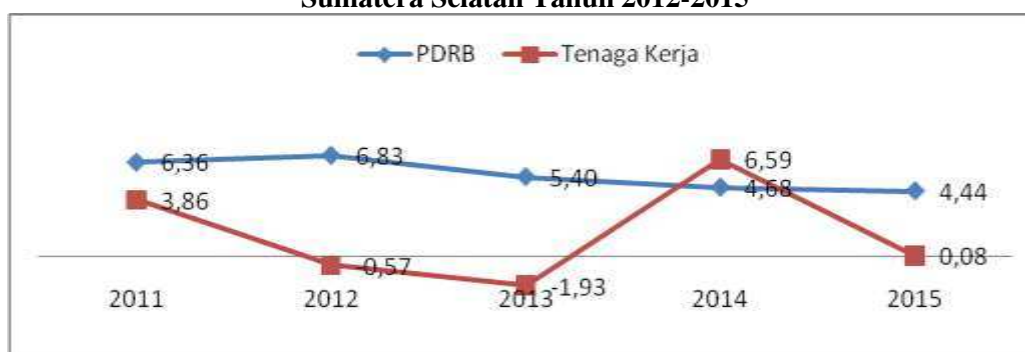
Gambar 1.2 Grafik Pertumbuhan Ekonomi dan Penyerapan Tenaga Kerja Sumatera Selatan Tahun 2012-2015

Berikut ini Gambar 1.2 menunjukkan grafik pertumbuhan ekonomi dan penyerapan tenaga kerja di Sumatera Selatan.