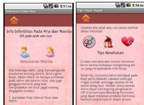
Gambar 4 Informasi Infertilitas dan Tips Cepat Hamil