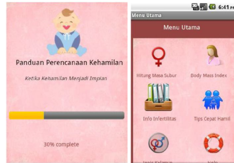
gambar 2 Splash Screen dan Menu Utama

Setiap kelas yang ada pada class diagram diimplementasikan dalam bahasa java, setiap kelas utama berupa file berekstensi .java. Antarmuka aplikasi diimplementasikan ke dalam sebuah file berekstensi .xml. Implementasi antarmuka tersebut adalah sebagai berikut: