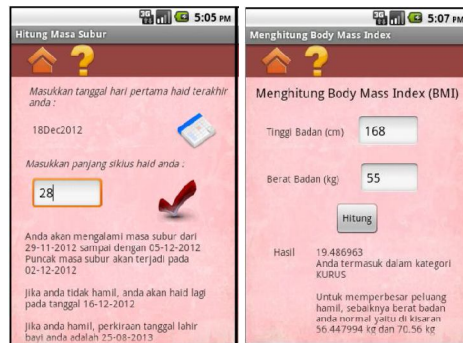
Gambar 3 Hitung Masa Subur dan Hitung BMI