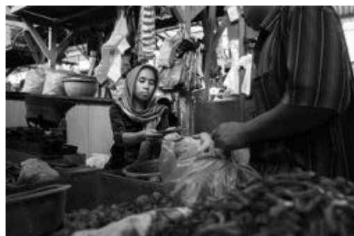
Gambar 3. Karya fotografi (Judul : Transaksi Dagang)