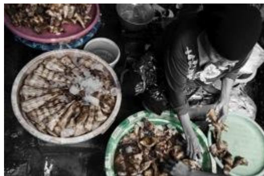
Gambar 2. Karya fotografi (Judul : Menata Daging Ikan)

Karya fotografi berupa karya yang menampilkan 30 foto terbaik yang dipilih dari foto yang sudah diambil saat pemotretan. 30 foto terbaik ini menggunakan media kanvas sebagai media cetak. Penggunaan kanvas digunakan agar terlihat unik dan menonjolkan sisi nilai budaya dan sosial dari foto yang dipamerkan. Ukuran kanvas foto, yaitu 12R (30 cm x40 cm).