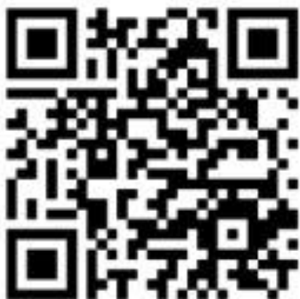
Gambar 13. QR code

berkunjung ke tempat pameran bisa mengakses karya-karya fotografi lewat QR Code tersebut.