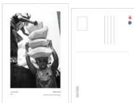
Gambar 11. Kartu pos (tampak depan dan tampak belakang)

Post card akan dibuat 10 seri. Post card sebagai souvenir untuk dibagikan kepada orang-orang yang berkunjung ke pameran. Ukuran post card, yaitu 4R (10,2 cm x 15,2 cm) . Pada bagian depan post card terdapat caption tentang foto, nama fotografer, dan tahun foto diambil. Pada bagian belakang post card terdapat judul pameran, tempat untuk meletakkan materai, dan tempat untuk catatan atau keterangan.