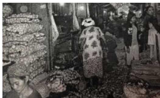
Gambar 2. Pasar rakyat : Pasar Pabean ini dikenal sebagai pasar rakyat yang dibangun oleh colonial Belanda tahun 1849.

mayoritas sudah sebagai pelanggan. Pengambilan ikan oleh konsumen, kelasnya bukan grosir melainkan ton. Biasanya para konsumen mengambil untuk dijual lagi ke luar pulau. Ikan-ikan yang dijual di pasar masih segar, bahkan lebih segar daripada supermarket. Pasar Pabean memperkenalkan sisi tradisional dan nilai-nilai yang terkandung lewat media sosial, seperti internet dan televisi sehingga masyarakat Surabaya dapat mengakses dan mendapatkan informasi seputar Pasar Pabean.