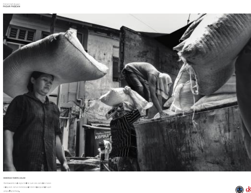
Gambar 10. Poster