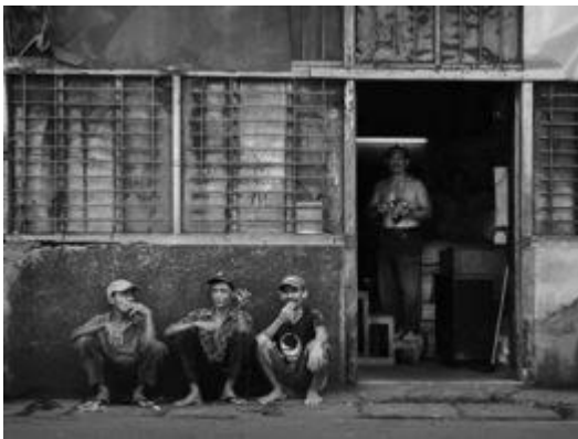
Gambar 7. Karya Fotografi (Judul : Menikmati Jam Istirahat)