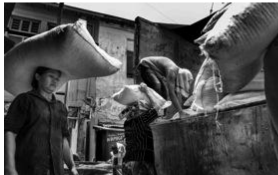
Gambar 4. Karya fotografi (Judul : Bekerja Tanpa Lelah)