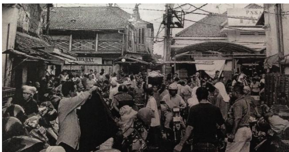
Gambar 1. Dua sungai : posisi jalan Pabean yang cukup strategis dengan diapit oleh dua sungai Pegirian dan Sungai Kalimas.

Adanya perluasan pasar merupakan hak pengelolaan Perusahaan Daerah Pasar Surya yang disahkan oleh Pemerintah Kota Surabaya. Pada awalnya Pasar Pabean hanya menempati areal tanah seluas 6.222 m 2 yang terdiri dari bangunan induk saja. Namun setelah adanya penambahan stand-stand baru yang menempati sayap kiri dan kanan bangunan induk maka luas Pasar Pabean kini mencapai 9.634 m 2 beserta lahan parkirnya (Data Monografi Pasar Pabean, 2000).