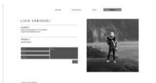
Gambar 12. Tampilan website