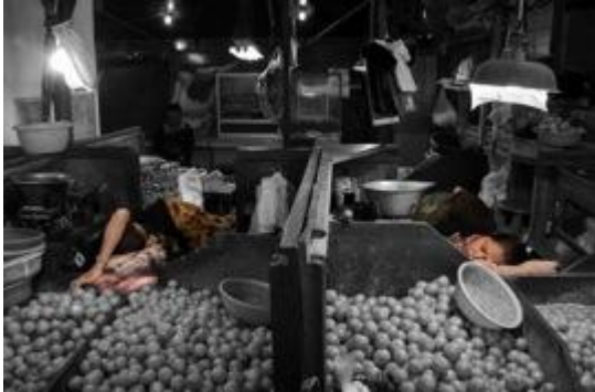
Gambar 6. Karya Fotografi (Judul : Menuai Mimpi)