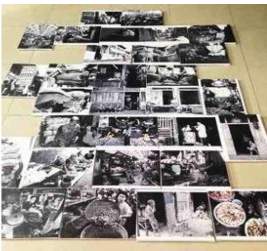
Gambar 8. 30 Karya fotografi dengan menggunakan kanvas.