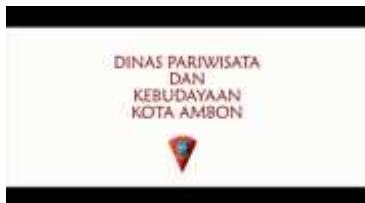
Gambar 1.10. Kerja sama dengan Dinas Pariwisata dan Kebudayaan Kota Ambon