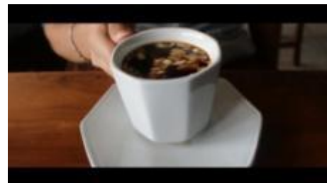
Gambar 1.18. Kopi Rarobang