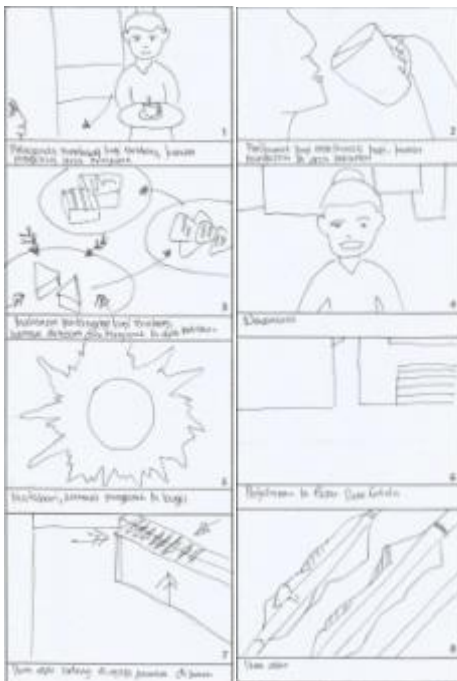
Gambar 1.4. Scene 17-24