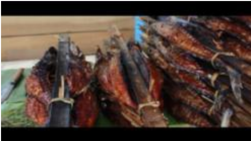
Gambar 1.21. Ikan Asar