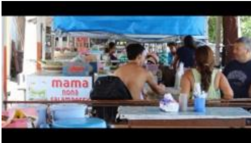
Gambar 1.28. Suasana Menikmati Rujak Natsepa di Pantai Natsepa