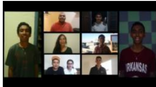
Gambar 1.32. Promosi Video Tambahan Wisata Kuliner Ambon