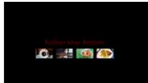
Gambar 1.33. Wisata Kuliner Ambon