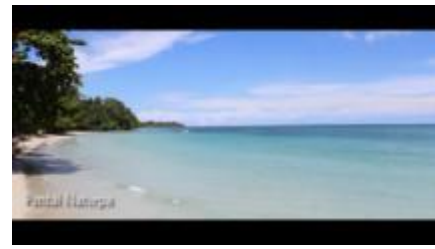
Gambar 1.14. Pantai Natsepa