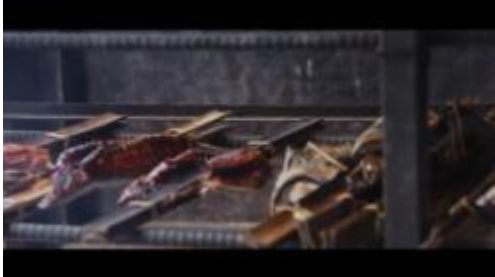
Gambar 1.20. Ikan Asar di Asapi