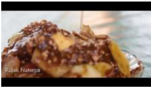
Gambar 1.27. Rujak Natsepa