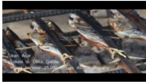
Gambar 1.23. Ikan Asar di Asapi