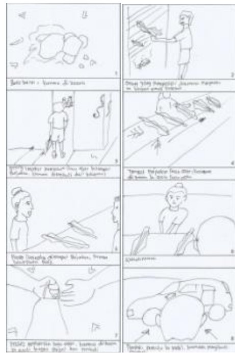
Gambar 1.5. Scene 25-32