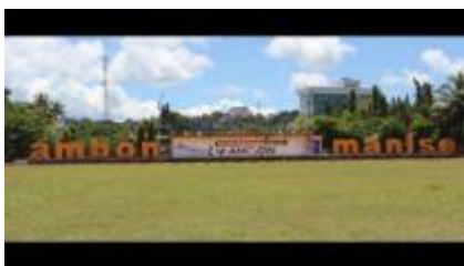
Gambar 1.13. Monumen Ambon Manise