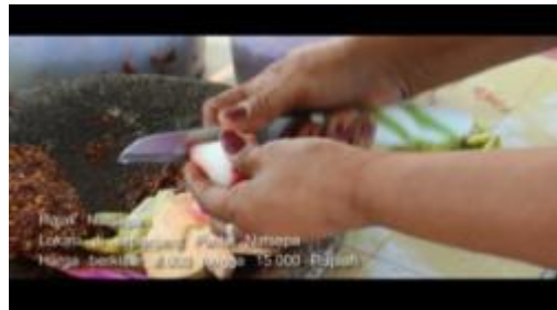
Gambar 1.25. Penjual Memotong Buah Untuk Membuat Rujak Natsepa