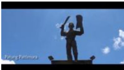
Gambar 1.12. Monumen Patung Pattimura