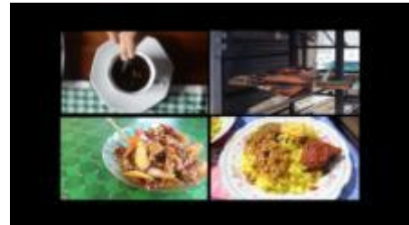
Gambar 1.15. Empat Kuliner Khas Yang di Angkat dalam Perancangan