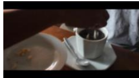
Gambar 1.17. Kopi Rarobang Sedang di Aduk