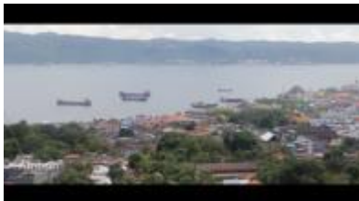
Gambar 1.11. Pemandangan kota Ambon