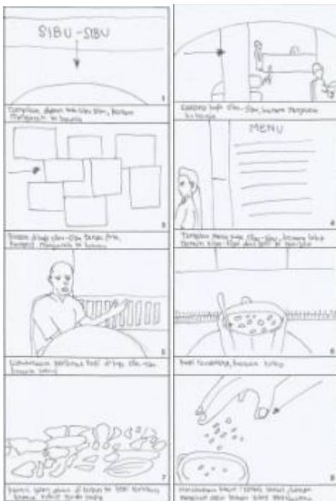
Gambar 1.3. Scene 9-16