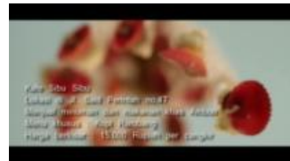
Gambar 1.16. Tambahkan Video dan Penjelasan Sebelum Masuk ke Kopi Rarobang