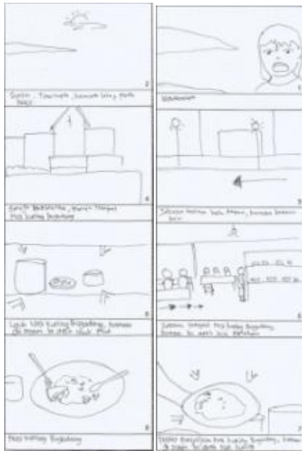
Gambar 1.7. Scene 41-48