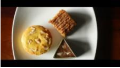
Gambar 1.19. Kuliner Pendamping Kopi Rarobang