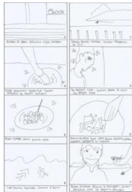
Gambar 1.6. Scene 33-40