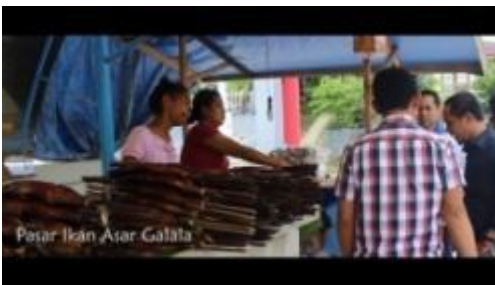
Gambar 1.22. Suasana Pasar Desa Galala