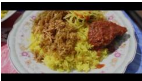
Gambar 1.30. Nasi Kuning 'Bagadang' Lengkap Dengan Lauknya