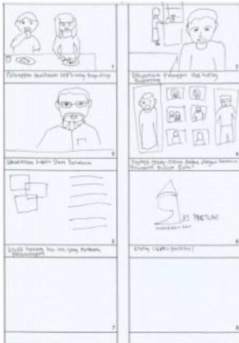
Gambar 1.8. Scene 49-56