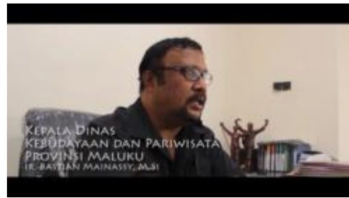
Gambar 1.31. Kepala Dinas Pariwisata Menjelaskan Tentang Ambon dan Kulinernya