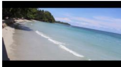
Gambar 1.26. Pantai Natsepa