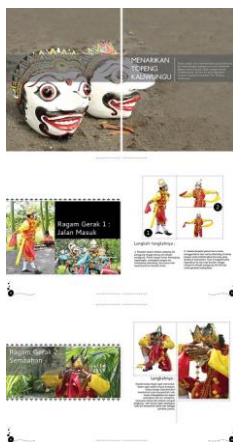
Gambar 3. Final layout halaman 13-18