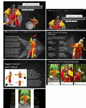
Gambar 17. Printscreen website