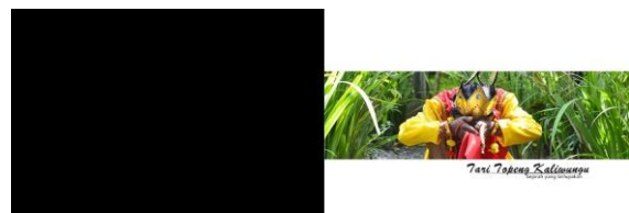
Gambar 12. Final cover notes