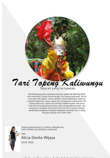
Gambar 8. Poster pameran