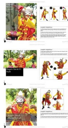
Gambar 5. Final layout halaman 25-30