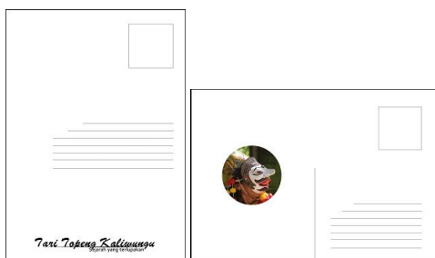
Gambar 10. Tampak belakang postcard