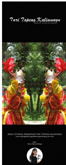
Gambar 14. Final brosur depan