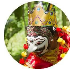
Gambar 16. Tampak depan gantungan kunci