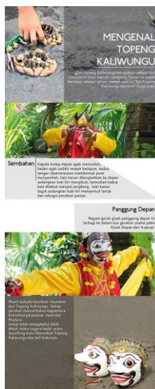
Gambar 15. Final brosur belakang