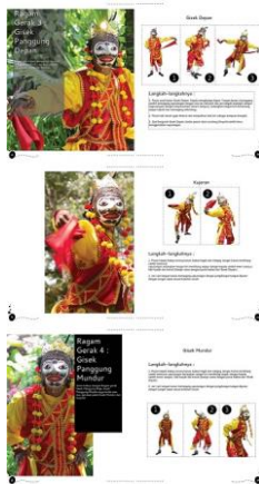
Gambar 4. Final layout halaman 19-24