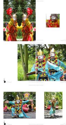
Gambar 7. Final layout halaman 55-60