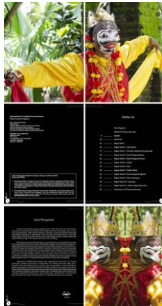
Gambar 2. Final layout halaman 1-6