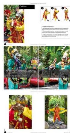
Gambar 6. Final layout halaman 43-48