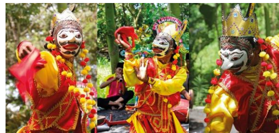
Gambar 11. Tampak depan postcard