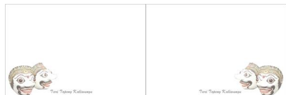
Gambar 13. Final isi notes