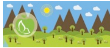
Gambar 6. Final desain mug