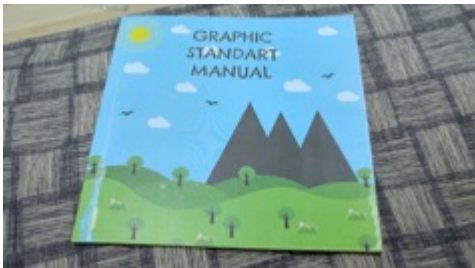
Gambar 8. Final desain graphic standart manual