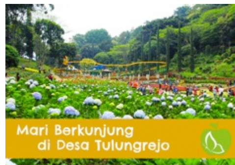
Gambar 8. Final desain billboard