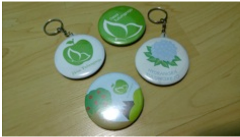
Gambar 8. Final desain gantungan kunci dan pin