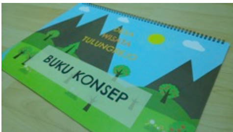
Gambar 8. Final desain buku konsep