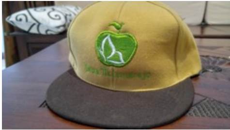
Gambar 8. Final desain topi