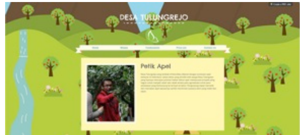
Gambar 8. Final desain website