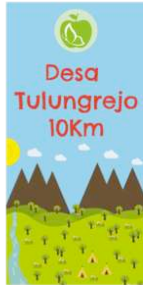
Gambar 7. Final desain banner