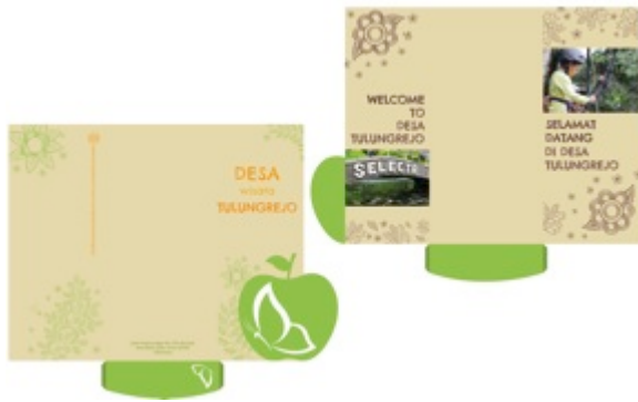
Gambar 3. Final desain cover brosur