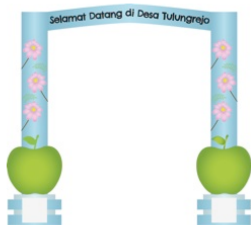
Gambar 8. Final desain gapura