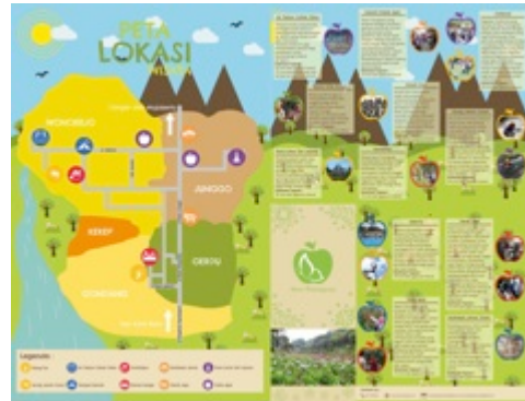
Gambar 1. Final desain brosur