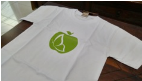
Gambar 8. Final desain baju