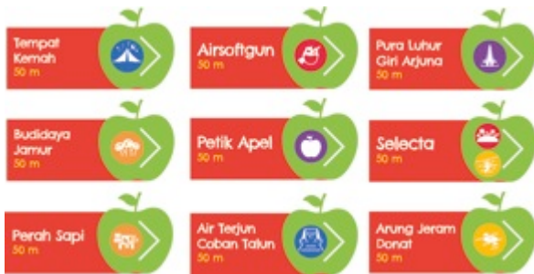
Gambar 4. Final desain signage