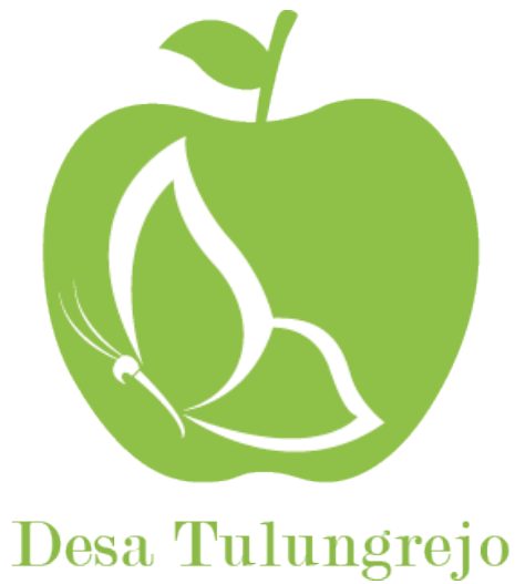
Gambar 5. Final desain logo