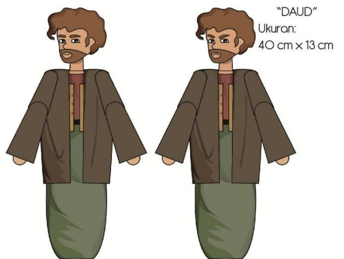
Gambar 5. Final artwork Daud