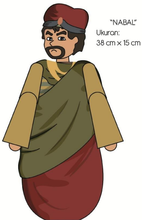
Gambar 8. Final artwork Nabal