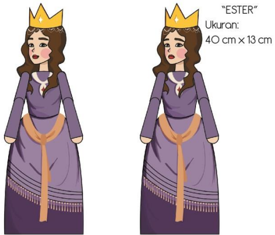
Gambar 3. Final artwork Ester