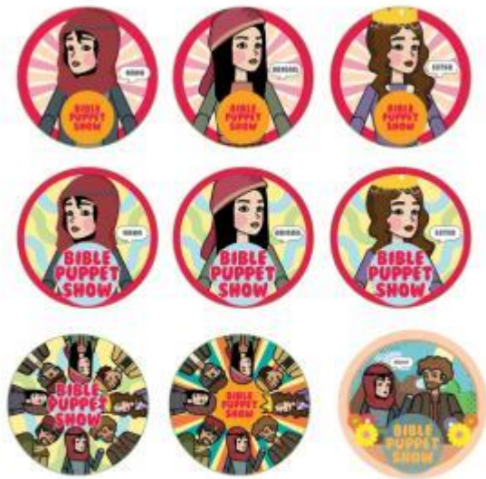
Gambar 17. Final artwork gantungan kunci dan pin