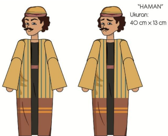
Gambar 12. Final artwork Haman