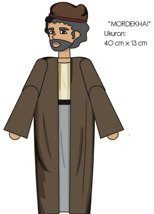
Gambar 9. Final artwork Mordekhai