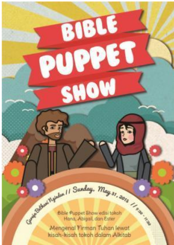
Gambar 15. Final artwork poster

Poster acara berfungsi sebagai media publikasi yang ditempatkan di depan ruang kelas atau di papan pengumuman.