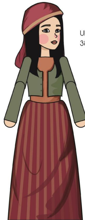
"ABIGAIL" Ukuran: 38 cm x 13 cm