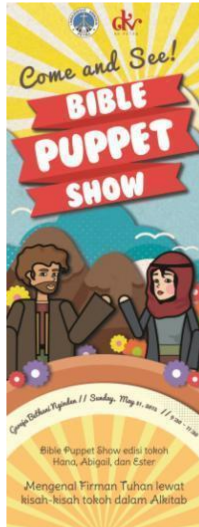
Gambar 16. Final artwork x-banner

Sebagai sarana publikasi yang ditempatkan di depan ruang kelas.