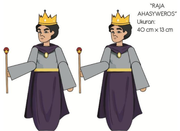
Gambar 6. Final artwork Raja Ahasyweros