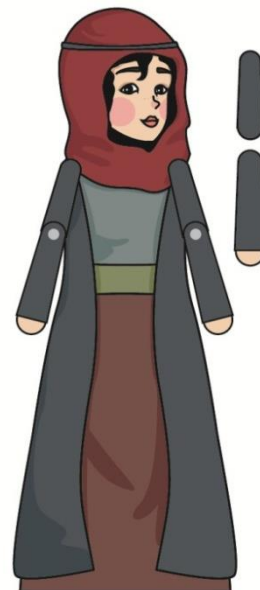
Gambar 14. Puppet structure

Sedangkan perancangan media pendukung meliputi: