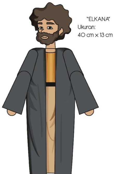
Gambar 4. Final artwork Elkana