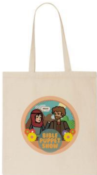
Gambar 18. Final artwork tote bag