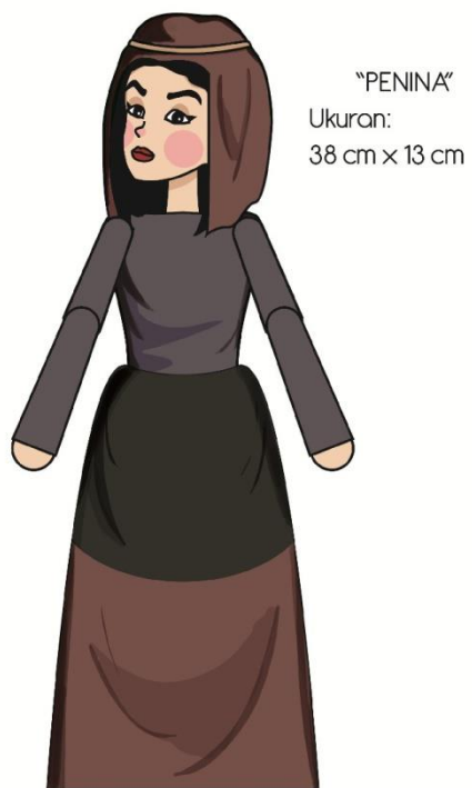
Gambar 7. Final artwork Penina