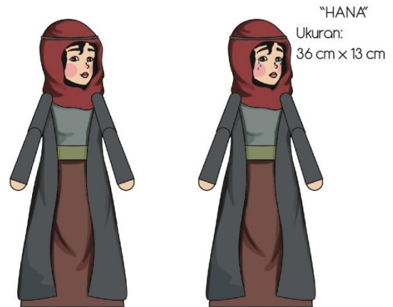
"HANA" Ukuran: 36 cm x 13 cm

Perancangan secara keseluruhan diperuntukkan bagi Sekolah Minggu kelas Pratama 1. Perancangan ini dibagi menjadi dua yaitu perancangan media utama dan media pendukung. Perancangan media utama meliputi puppet dan panggung boneka.