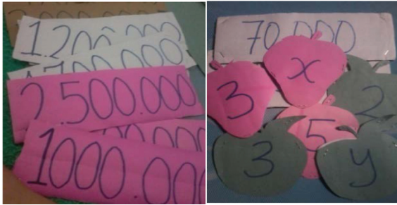
Gambar 2. Media Visual dalam Memperkenalkan Konsep Matriks

Siswa-siswa yang lain mengamati media yang dipegang temannya dan menentukan matriks-matriks yang terbentuk. Kegiatan ini sangat memfasilitasi satu-satunya siswa dengan tipe kecerdasan dominan spasial di kelas tersebut. Dilihat dari hasil tes, siswa tersebut termasuk kelompok yang memiliki prestasi belajar rendah pada mata pelajaran matematika. Akan tetapi, skor gain yang diperoleh siswa tersebut berada pada kategori sedang. Dengan kata lain, peningkatan yang terjadi cukup signifikan dan lebih tinggi daripada siswa naturalis dan siswa interpersonal-naturalis. Temuan ini didukung oleh Gardner (2011:10) yang menyatakan bahwa saat ini tidak dibutuhkan banyak orang yang memiliki kecerdasan tinggi atau kecerdasan ganda, yang dibutuhkan adalah