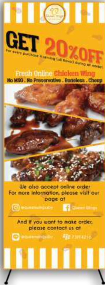
Gambar 14. Desain X-banner