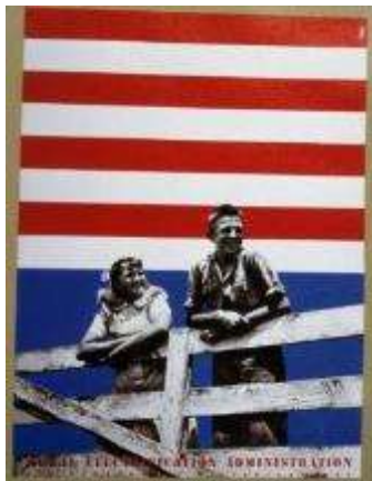
Gambar 6. Desain Late Modern karya Lester Beall Sumber: https://www.studyblue.com/notes/note/n/1935-american-or-late-modern/deck/11017212

https://thepicture.wordpress.com/2007/10/16/sebbintteel/