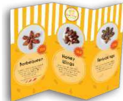
Gambar 8. Desain Brosur