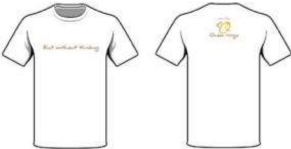
Gambar 10. Desain T-shirt