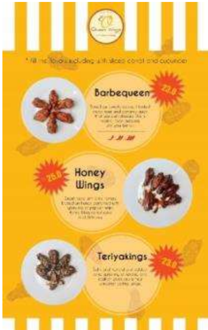
Gambar 9. Desain Daftar Menu