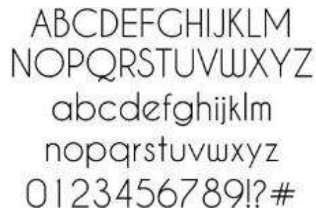
Gambar 4. Font Caviar Dreams