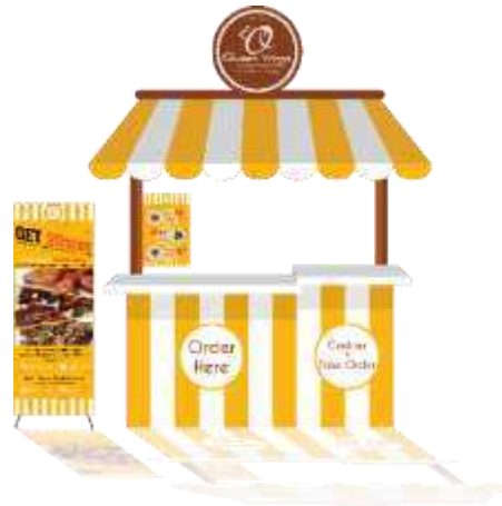
Gambar 7. Desain Booth

Berikut adalah gambar hasil perancangan dari media utama yang telah dibuat: