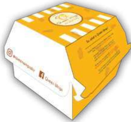
Gambar 12. Desain Kemasan