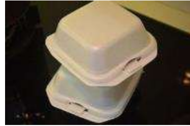
Gambar 2. Foto kemasan Queen Wings

Ibu Liana sadar bahwa ia perlu melakukan strategi promosi yang efektif, dan membangun identitas usahanya secara visual agar semakin meyakinkan konsumennya bahwa beliau serius untuk membangun usahanya, dan melalui perancangan inilah diharapkan Queen Wings dapat dikenal tidak hanya dari kalangan sendiri melainkan juga bagi para penikmat kuliner di Surabaya.