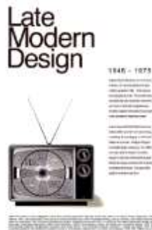
Gambar 5. Desain Late Modern

Selain itu terdapat pula pesan visual menggunakan gaya desain Late Modern agar memunculkan kesan yang santai dan kreatif sesuai dengan tagline yang diusung namun tidak menutup kemungkinan bila gaya desain yang lain turut mendukung pesan visual yang dirancang. Berikut beberapa contoh gaya desain Late Modern .