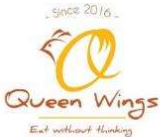
Gambar 3. Logo Queen Wings

Strategi dalam merancang identitas visual antara lain ialah mendesain huruf Q yang merupakan singkatan dari Queen kemudian didesain agar membentuk seperti bagian badan dan sayap dari seekor ayam, kemudian ditambahkan kepala dan jambul agar huruf Q tersebut membentuk siluet seekor ayam. Font “Daniel” dipakai agar memunculkan kesan mewah dan eksklusif dari sebuah merek Queen Wings. Warna hangat seperti kuning, merah, dan coklat adalah warna yang meningkatkan nafsu makan, sehingga mengundang seseorang untuk mencoba membeli produk Queen Wings. Kemudian elemen grafis garis kuning dan putih menunjukkan kesan yang dinamis dan simpel.