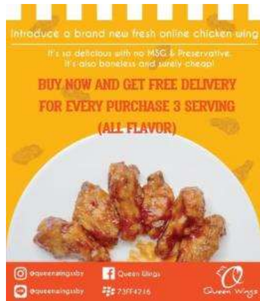
Gambar 13. Desain Poster Digital dan Print Ad Koran