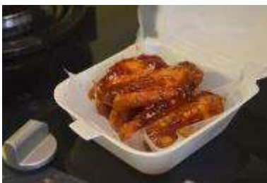
Gambar 1. Foto menu Barbeque

Awalnya Queen Wings sendiri diperkenalkan oleh Ibu Liana hanya sebatas teman reuni dan dari mulut ke mulut saja, serta tidak ada brosur dan logo sebagai sebagai media pendukung promosi, hal inilah yang menjadikan usahanya sulit merambah konsumen yang luas. Sebagai contoh adalah kemasan yang ditawarkan Queen Wings cenderung polos tanpa ada perbedaan untuk jenis menunya, padahal jika dikemas dengan menarik tidak menutup kemungkinan akan menarik minat konsumen.