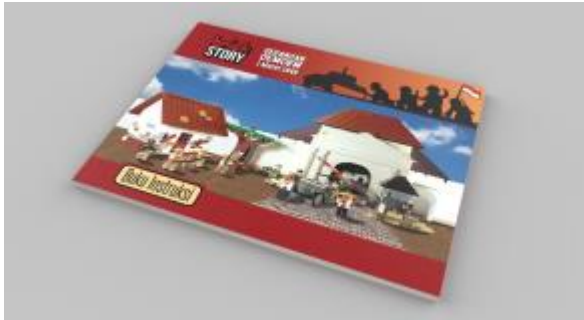
Gambar 4. Desain final buku instruksi