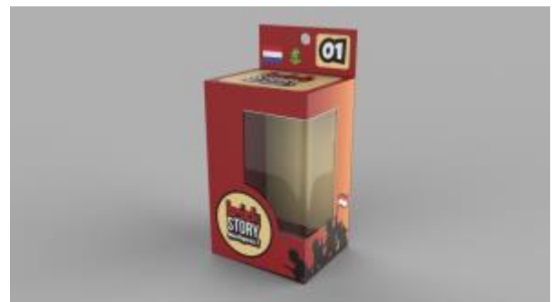
Gambar 7. Desain final kemasan collectible minifigure tentara Belanda