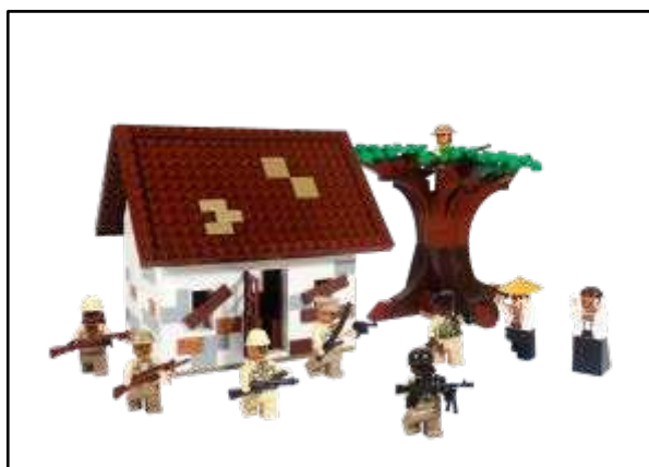
Gambar 2. Bentuk jadi rumah dan pohon