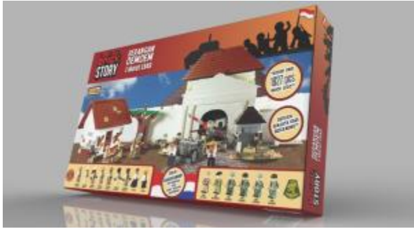
Gambar 3. Desain final kemasan

dilakukan terhadap target audience , baik primer maupun sekunder.