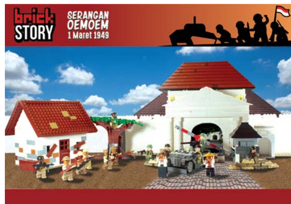
Gambar 8. Poster

Media pendukung dari perancangan ini adalah poster, postcard , dan sticker . Media ini nantinya ditujukan sebagai gimmick , diberikan kepada pembeli playset ini.