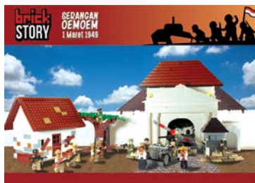
Gambar 9. Postcard