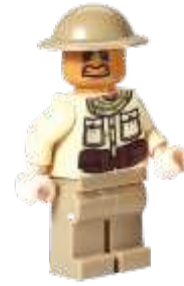
Gambar 6. Minifigure tentara Indonesia yang sudah diberi decal baru