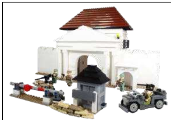
Gambar 1. Bentuk jadi benteng, pos penjagaan dan jeep