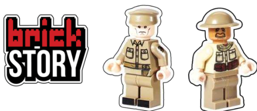
Gambar 11. Sticker