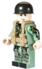
Gambar 5. Minifigure tentara Belanda yang sudah diberi decal baru