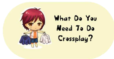
Gambar 3. Contoh Sub-bab yang membagi bagian yang satu dengan lainnya

chibi juga digunakan untuk membagi sub-bab penting dalam kategori-kategori informasi yang akan diberikan, dengan kejelasan kegiatan karakter terhadap kategori yang akan dijelaskan. Kategori yang dijelaskan berupa sejarah cosplay , pengenalan crossplay , hal-hal yang dibutuhkan untuk memulai crossplay , karakter, face dan body type , make up , wig, kostum, gesture , dan foto.