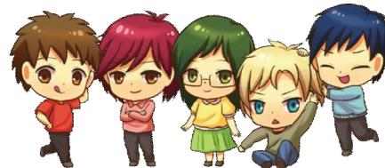
Gambar 2. Karakter chibi dengan berbagai pose

Buku ilustrasi merupakan buku dengan kumpulan berbagai ilustrasi dan dikemas dengan cover berisi ilustrasi menarik, dalam konteks ini, buku ilustrasi merupakan buku yang mengandung banyak ilustrasi dan beberapa teks untuk mendukung informasi yang akan disampaikan. Ilustrasi menjadi semakin menarik apabila memiliki warna, dengan adanya warna, pembaca maupun target audiens akan tidak bosan terhadap dengan isi buku, karena menjadi lebih bersinar, pengerjaan karakter-karakter chibi dengan pewarnaan yang menarik membantu untuk menangkap desain yang dibuat.