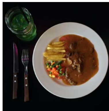
Gambar 2. Foto Produk Bitter Sweet Cafe

Bitter Sweet Cafe adalah restoran keluarga yang dikelola oleh Hartono dan sang istri yang membantu dalam mendesain cafenya dan melakukan inovasi-inovasi dalam hal pembuatan steak dan minuman. Selain berperan langsung dalam pembuatan steak dan minuman, pemilik Bitter Sweet Cafe juga mempercayakan kepada beberapa orang chef yang membantunya dalam mengolah cafe.