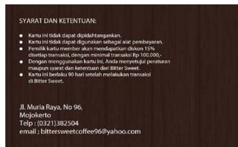
Gambar 10. Kartu Member Sisi Belakang