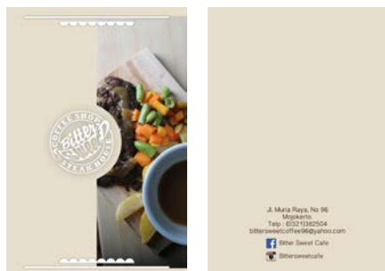
Gambar 13. Cover Note Book