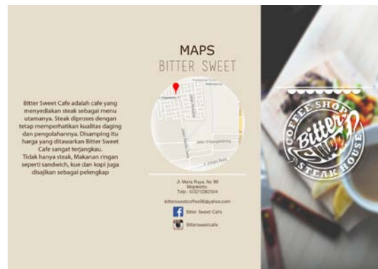
Gambar 3. Brosur Bagian Luar