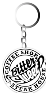
Gambar 15. Gantungan Kunci