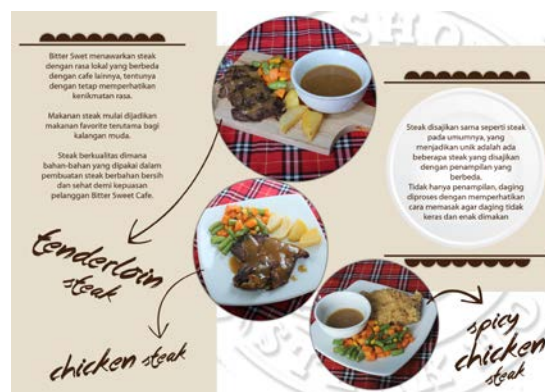
Gambar 4. Brosur Bagian Dalam