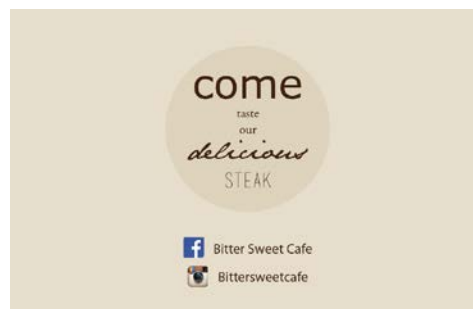
Gambar 8. Kartu Nama Sisi Belakang