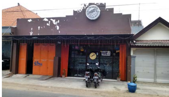
Gambar 1. Lokasi Bitter Sweet Cafe

Nama perusahaan : Bitter Sweet Cafe Lokasi : Jl. Mulia Raya No. 96 Mojokerto Berdiri : Tahun 2014 Jenis makanan : Steak, pasta, burger, sandwich , dan berbagai jenis makanan western lain dan minuman Menu unggulan : Berbagai macam steak Kelebihan : Steak diproses dengan memperhatikan cara pemasakan yang benar dan bahan untuk mengolahnya pun sangat diperhatikan kualitasnya.