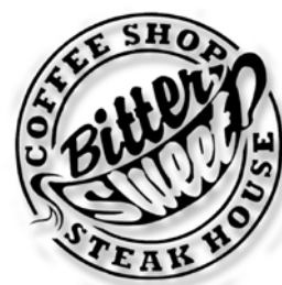
Gambar 16. Ambient Media

Ambient media merupakan salah satu media promosi unik atau berbeda dibandingkan media promosi pada umumnya. Kegunaan ambient media yang akan dipakai adalah memberitahukan, memperkenalkan dan selalu mengingatkan produk baru dari Bitter Sweet Cafe.