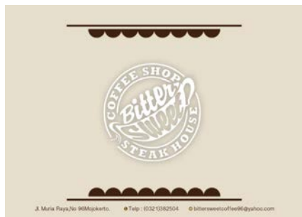
Gambar 11. Cover Kalender Meja