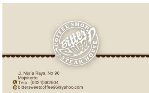
Gambar 7. Kartu Nama Sisi Depan

Kartu nama merupakan salah satu media yang menonjolkan identitas perusahaan dan merupakan media yang menjadi penghubung dengan perusahaan lainnya dan konsumen. Dengan memiliki identitas dan kesatuan desain yang jelas maka akan meningkatkan citra perusahaan juga karena kartu nama merupakan alat perusahaan untuk memberikan informasi kepada target audience , rekan kerja, dan lain sebagainya tentang informasi pemilik perusahaan, lokasi perusahaan, dan lain-lain.