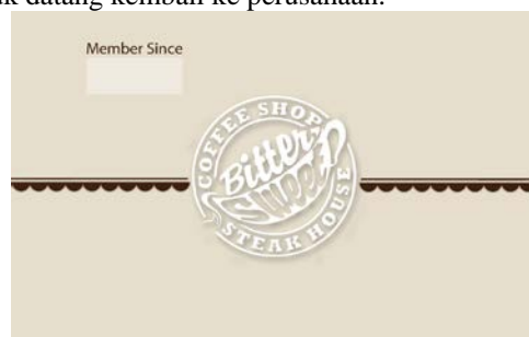
Gambar 9. Kartu Member Sisi Depan

Kartu Member juga merupakan penghubung konsumen dengan perusahaan. Dengan Kartu member konsumen akan merasa memiliki hubungan dengan perusahaan, selain itu kartu member juga secara tidak langsung mengingatkan dan mengajak konsumen untuk datang kembali ke perusahaan.