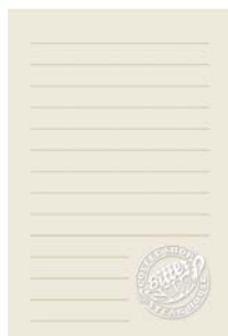
Gambar 14. Isi Note Book