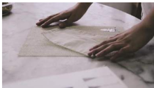
Gambar 30. Final penggunaan table mat