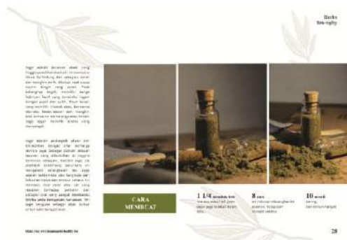
Gambar 17. Final buku halaman 27-28