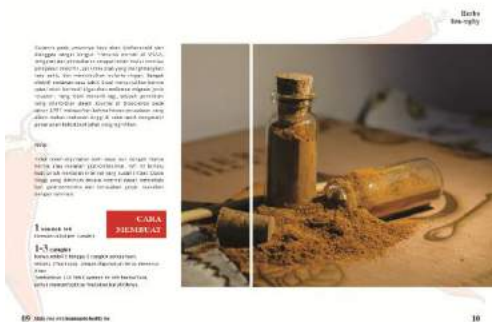
Gambar 8. Final buku halaman 9-10