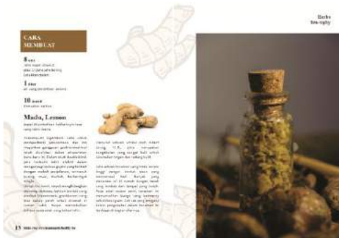
Gambar 10. Final buku halaman 13-14