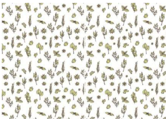
Gambar 3. Final motif