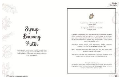
Gambar 12. Final buku halaman 17-18