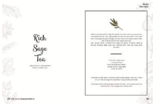
Gambar 18. Final buku halaman 29-30