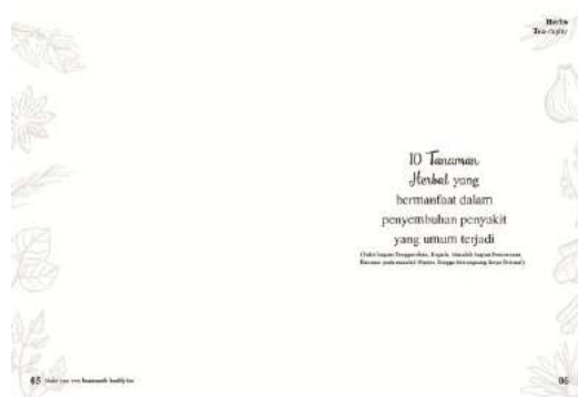
Gambar 6. Final buku halaman 5-6