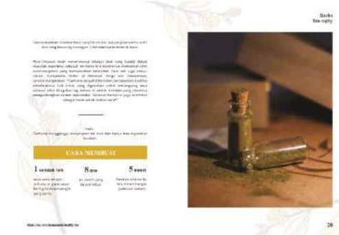
Gambar 13. Final buku halaman 19-20