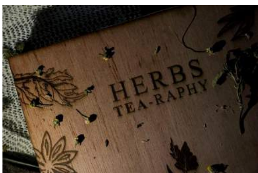
Gambar 26. Final cover