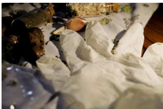
Gambar 25. Final sarung tangan