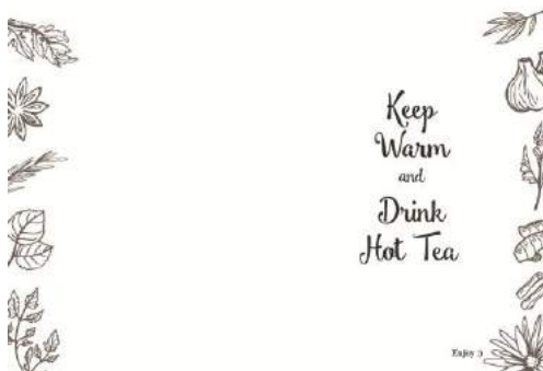
Gambar 19. Final buku halaman 31-32