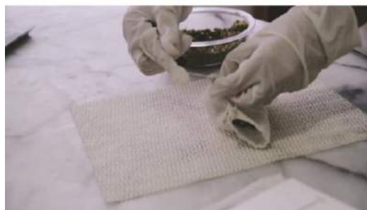
Gambar 29. Final penggunaan kain saring