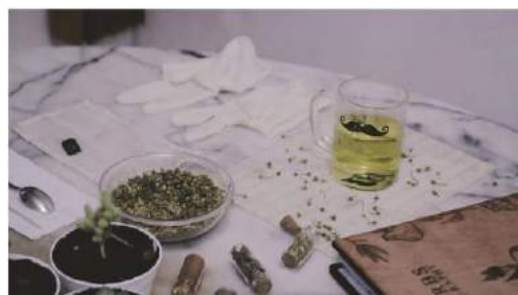
Gambar 31. Final hasil akhir