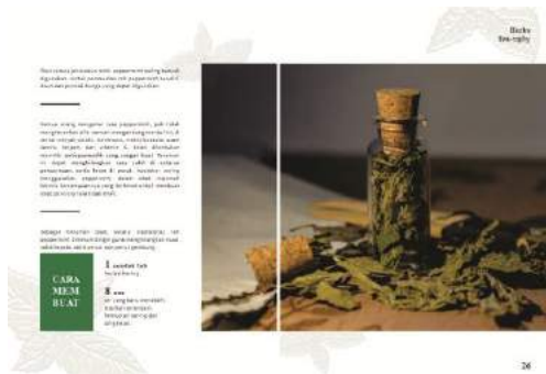
Gambar 16. Final buku halaman 25-26