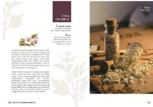
Gambar 14. Final buku halaman 21-22