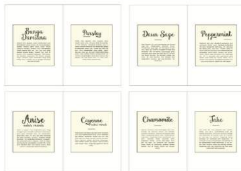
Gambar 20. Final layout kalkir