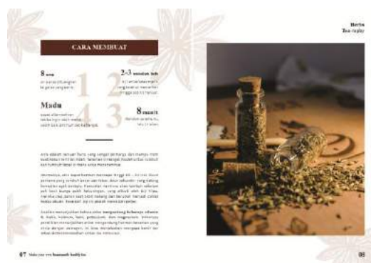
Gambar 7. Final buku halaman 7-8