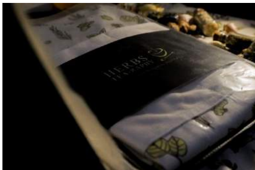
Gambar 24. Final celemek