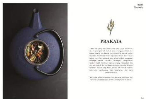
Gambar 5. Final buku halaman 3-4