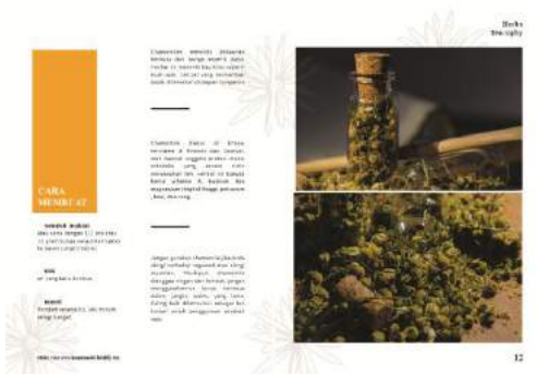
Gambar 9. Final buku halaman 11-12