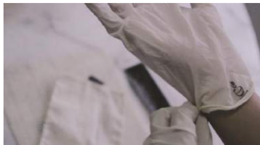
Gambar 28. Final penggunaan sarung tangan