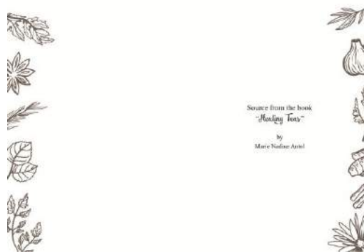
Gambar 4. Final sub cover