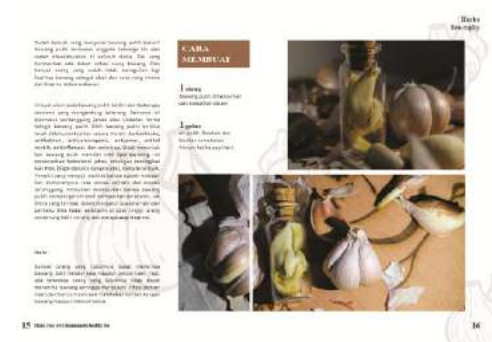
Gambar 11. Final buku halaman 15-16