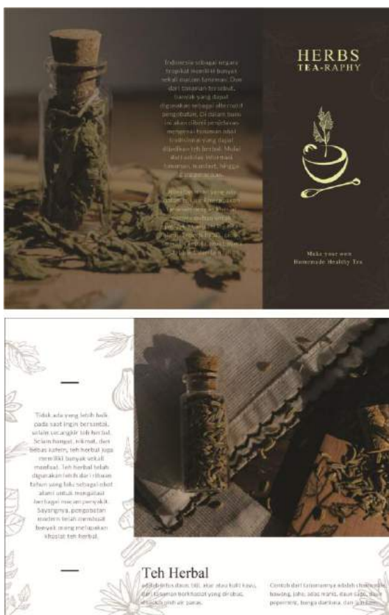
Gambar 33. Final layout brosur