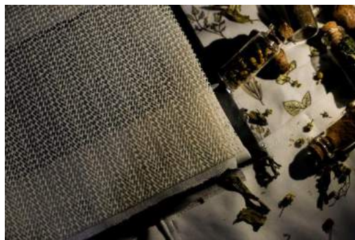
Gambar 22. Final table mat