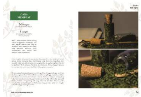
Gambar 15. Final buku halaman 23-24