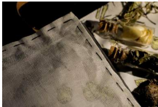
Gambar 23. Final kain saring