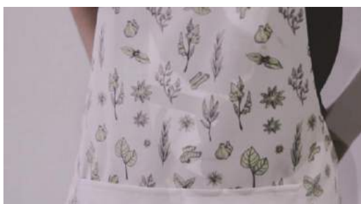
Gambar 27. Final penggunaan celemek