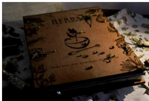
Gambar 21. Final buku tampak depan