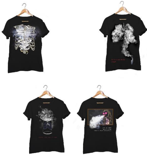
Gambar 1.3 Desain Baju