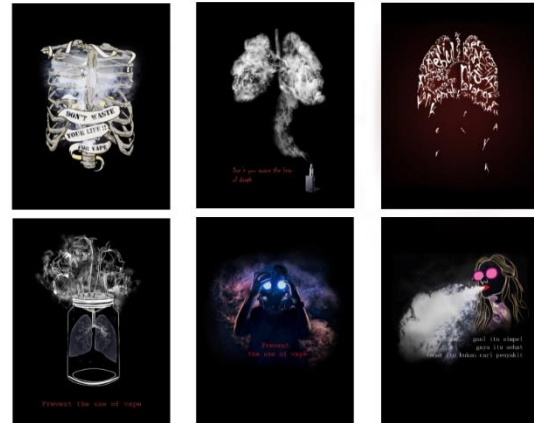
Gambar 1.1 Tight Tissue Media

Pada pesan visual akan digunakan fotografi yang menggunakan metode digital imaging sesuai dengan informasi yang akan disampaikan nantinya. Penggunaan fotografi akan disandingkan dengan pesan verbal yang mengena sehingga akan mengakibatkan pesan tersebut akan tersampaikan dengan benar, yang tidak akan menimbulkan interpretasi yang berbeda-beda dari audience yang melihatnya.