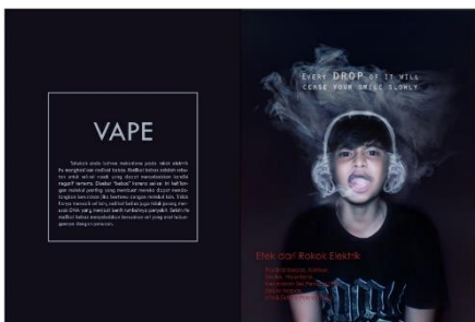
Gambar 1.4 Desain Majalah