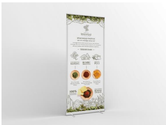
Gambar 24. Banner