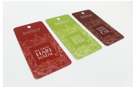
Gambar 16. Seasonal tag untuk shopping bag

bag terbuat dari kertas ivory, sedangkan kemasan kardus terbuat dari material corrugated paper . Pada kemasan tersier, informasi yang dicantumkan berupa logo Kampung Semanggi dan informasi mengenai media sosial dari Kampung Semanggi.