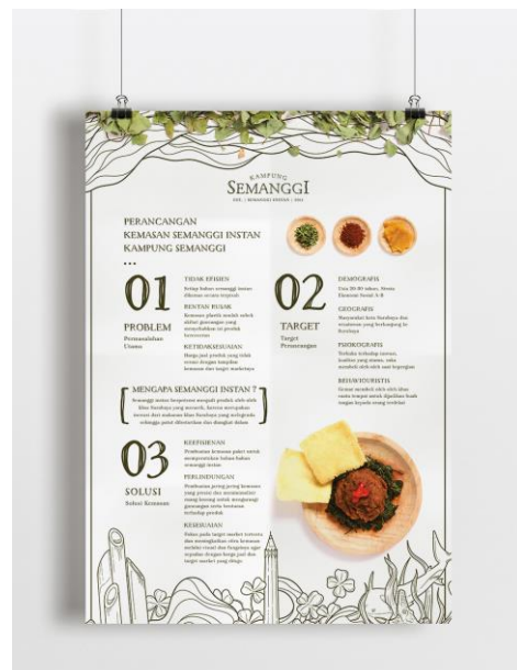
Gambar 26. Poster konsep