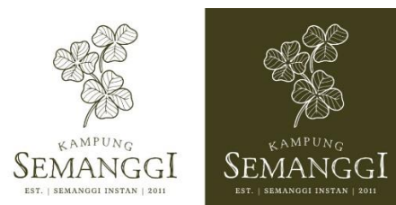
Gambar 5. Final logo aplikasi 1

Melalui hasil observasi dan penggalan data yang telah dilakukan, dibuatlah sebuah desain logo untuk mencerminkan brand dan identitas semanggi instan merek Kampung Semanggi yang baru. Logo Kampung Semanggi terdiri atas dua bagian logo, yakni logogram dan logotype yang keduanya dapat digunakan secara terpisah maupun menjadi satu kesatuan logo. Logo tersebut didesain menggunakan satu warna utama, yakni hijau dan putih. Warna hijau dipilih karena mencerminkan warna dari produk yakni daun semanggi yang didominasi oleh warna hijau. Selain itu, warna hijau dipilih untuk membangkitkan kesan alami dan natural serta sehat pada produk semanggi instan. Pada logotype , pemilihan font pada logo menggunakan dua jenis font yang berbeda antara lain serif dan sketchy dekoratif. Font sketchy dekoratif digunakan pada tulisan Kampung Semanggi sebagai merek dari produk semanggi instan, sedangkan, font serif digunakan untuk sub brand dengan ukuran point huruf yang lebih kecil yang bertuliskan tahun berdirinya usaha tersebut, pada tahun 2011 dan produk utama yang dijual, yakni semanggi instan. Logogram pada logo Kampung Semanggi menggunakan bentuk dari tiga buah daun semanggi, untuk menggambarkan produk yang dijual maupun brand dari Kampung Semanggi.