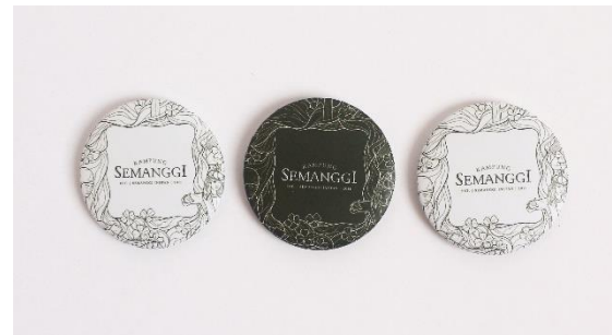
Gambar 20. Pin