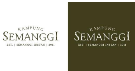
Gambar 6. Final logo aplikasi 2