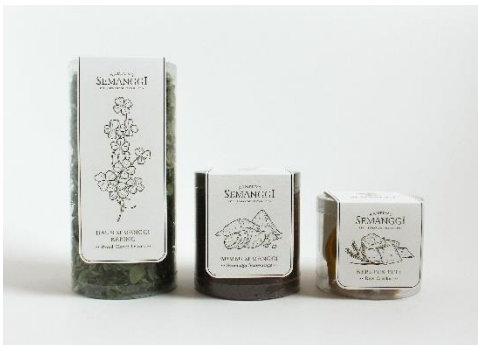
Gambar 9. Kemasan primer paket semanggi instan