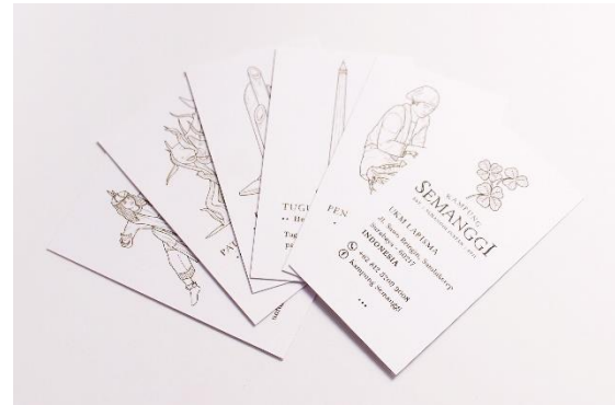
Gambar 19. Kartu nama

Promosi pada perancangan ini hanya sebagai penunjang untuk memperkenalkan produk semangi instan merek Kampung Semangi dengan tampilannya dan positioningnya yang baru di masyarakat, terutama kepada target market yang disasar. Setiap media promosi pada perancangan ini berhubungan langsung dengan produk dan brand Kampung Semangi itu sendiri. Melalui promosi, diharapkan masyarakat lebih mengenal produk semangi instan merek Kampung Semangi sebagai salah satu alternatif pilihan oleh-oleh khas Surabaya.