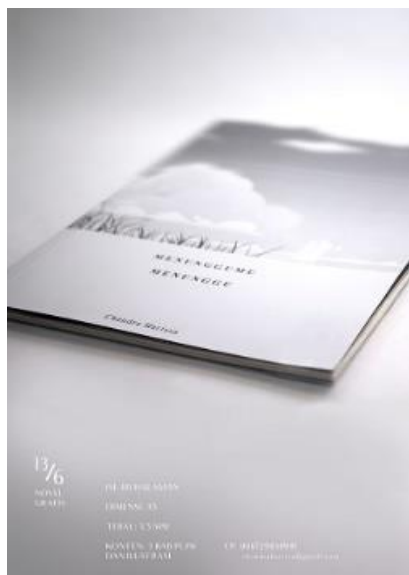
Gambar 4. Final poster karya