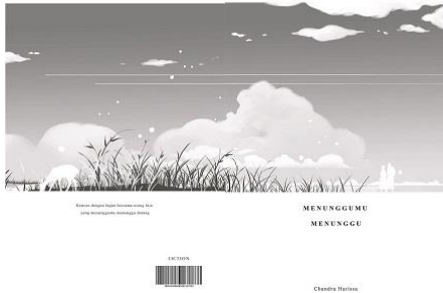
Gambar 1. Final sampul novel grafis