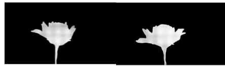
Gambar 6. Final teaser trailer