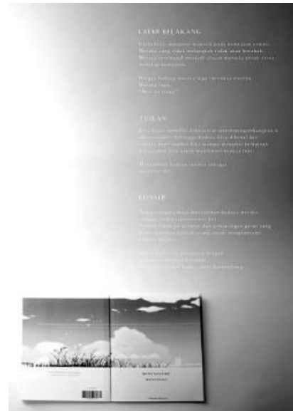
Gambar 5. Final poster konsep