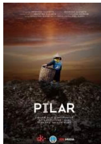
Gambar 6. Poster Film