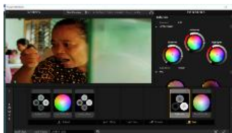
Gambar 2. Color Grading