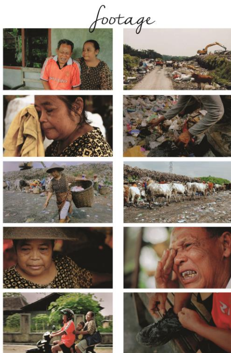
Gambar 4. Footage Film.