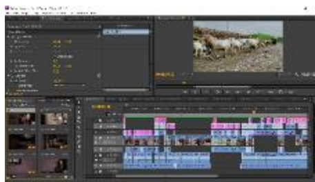
Gambar 1. Editing offline

Editing menggunakan software Adobe Premiere CS6 dan Adobe After Effect CS6.