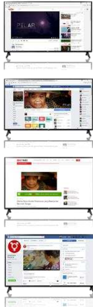
Gambar 5. Sosial Media

Film dokumenter yang akan diunggah di Facebook, YouTube dan Instagram serta memiliki media partner yaitu IDN Media dan Indonesia Feminis sehingga dapat ditonton sebagian besar masyarakat dan memberi manfaat bagi penonton.