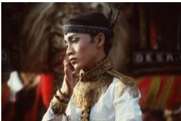
Gambar 1. Gemblak

Saat mendengar Reog Ponorogo, yang akan muncul di benak adalah tarian barong yang diikuti dengan penari-penari dengan keragaman jenis tari. Tetapi banyak masyarakat yang tidak mengetahui tentang siapa dan apa julukan penari-penari tersebut. Terutama masyarakat diluar kota Ponorogo. Para penari yang ada dalam pementasan Reog Ponorogo yang sering terlihat adalah yang ditarikan oleh perempuan karena bentuknya yang gemulai di awal pementasan menjadikan awalnya menarik. Sedangkan pada tradisionalnya, tarian perempuan ditarikan oleh remaja laki-laki, yang disebut sebagai gemblak.