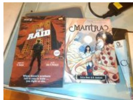
Gambar 2. Contoh novel grafis lokal

Komik novel grafis, istilahnya pertama kali di kemukakan oleh Will Eisner. Yang membedakan novel grafis dengan komik lainnya adalah pada tema-tema yang lebih serius dengan panjang cerita yang hampir sama dengan novel yang ditunjukkan bagi pembaca yang bukan anak-anak. Istilah ini juga untuk menghilangkan kesan bahwa komik adalah suatu media yang dicap murahan. ("Jenis-Jenis Komik", par. 4). Biasanya isi ceritanya lebih panjang dan komplikasi, serta membutuhkan tingkat berpikir yang lebih dewasa untuk membacanya. Isi buku bisa lebih dari 100 halaman. Bisa juga dalam bentuk seri atau cerita putus. ("Tulisan Tutorial Jenis Rupa Komik", par. 8).