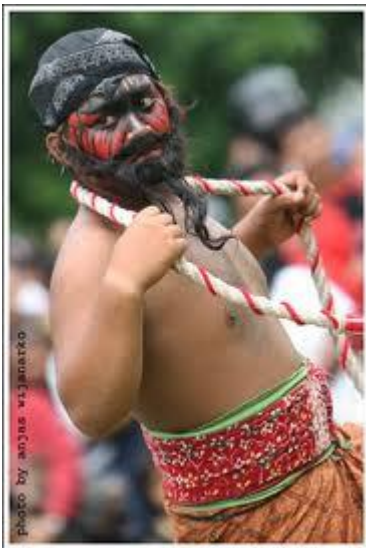
Gambar 3. Warok yang sedang membawa usus-usus

Cerita pada novel grafis tidak dilanjutkan sampai akhir, yaitu saat cerita sesudah penyelamatan Prpto oleh Sapto karena keterbatasan waktu. Karakter yang muncul pada novel grafis ada delapan. Sapto, Prpto, Hardo Wiseso, Mak Menuk, Kepala Kampung, Prabowo, Eyang Legong Kamplok, dan Lastri.