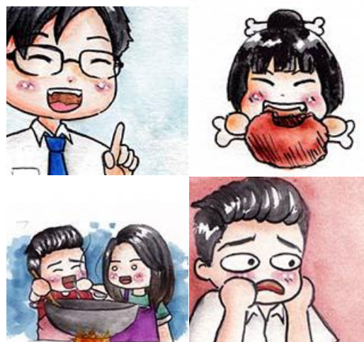
Gambar 2. Cover episode