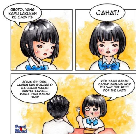
Gambar 6. Contoh upload Instagram