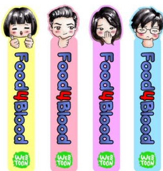
Gambar 10. Contoh pembatas buku