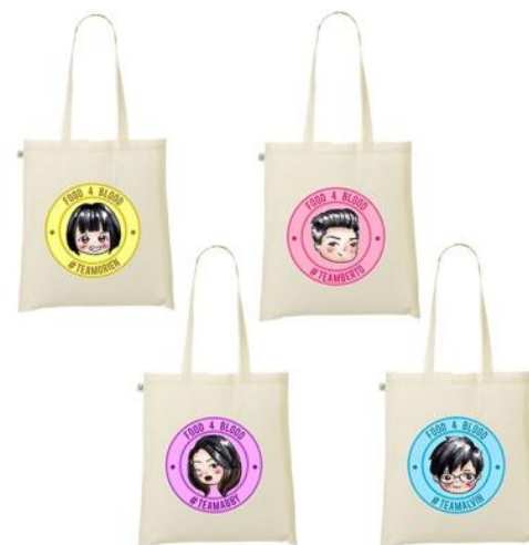
Gambar 8. Contoh totebag