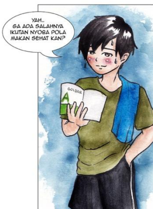
Gambar 4. Contoh episode 12