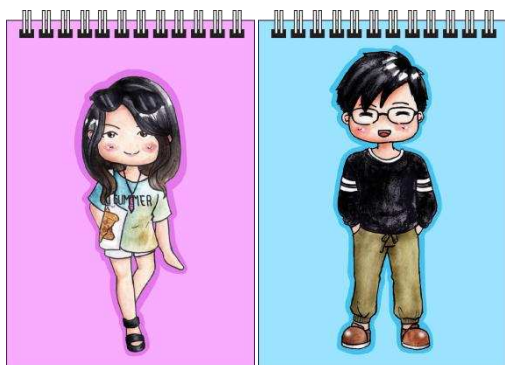
Gambar 9. Contoh notes