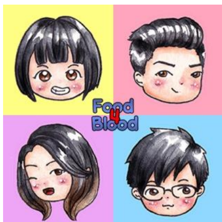
Gambar 1. Cover Webtoon utama