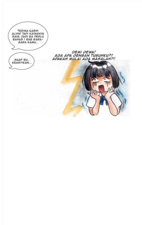
Gambar 3. Contoh episode 4