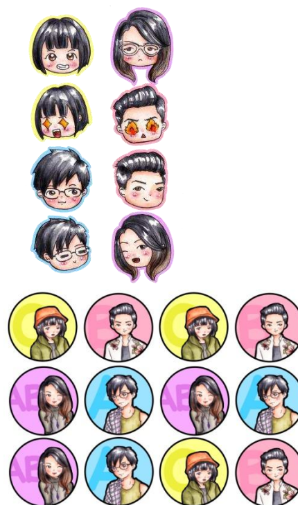
Gambar 7. Contoh sticker