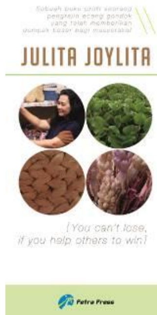
Gambar 8. Media X-banner