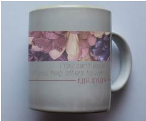
Gambar 10. Media mug