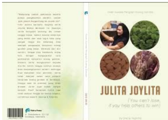
Gambar 4. Final cover buku

Perancangan Buku Profil Julita ini akan menggunakan desain yang elegan dan feminim. Guna menunjukkan sekaligus memperkenalkan Julita kepada masyarakat luas. Ide ini terambil dari sosok Julita sendiri yang memang sangat peduli pada lingkungan dan kepada para wanita. Sikap ramah yang dimiliki Julita menjadi kunci dalam pembuatan buku ini, dimana buku ini nantinya akan menjadi buku yang ramah pada masyarakat.