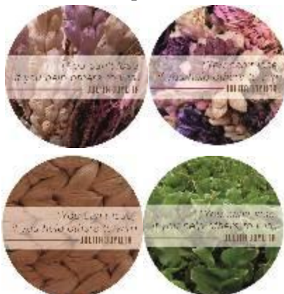
Gambar 12. Media pin