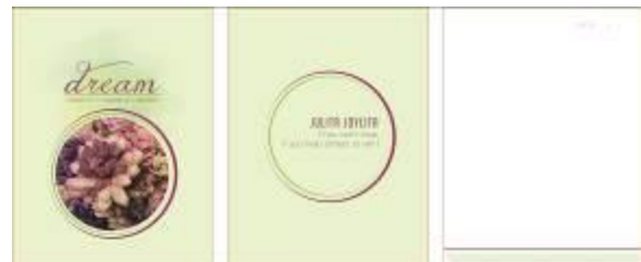
Gambar 7. Media notes