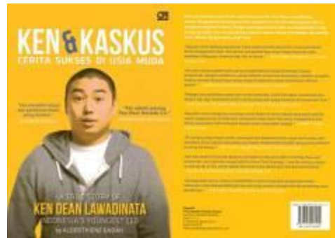
Gambar 1. Cover depan dan cover belakang buku Ken & Kaskus