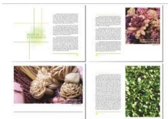
Gambar 5. Final layout buku