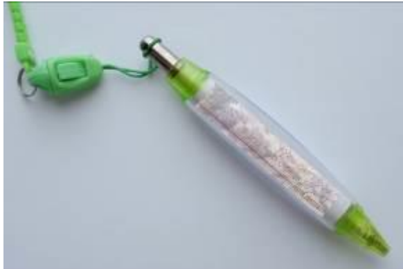
Gambar 9. Media bolpoin