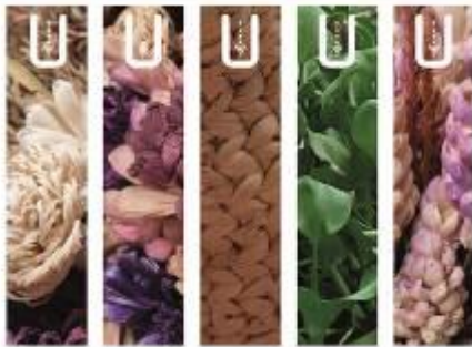
Gambar 11. Media pembatas buku