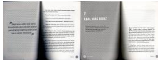
Gambar 2. Layout buku Ken & Kaskus